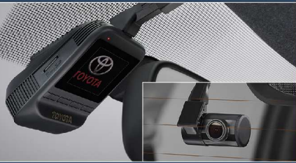
กล้องบันทึกภาพด้านหน้าและหลัง