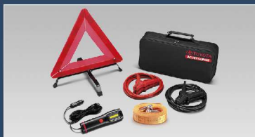
ชุดอุปกรณ์ฉุกเฉิน (แบบกระเป๋าผ้า)