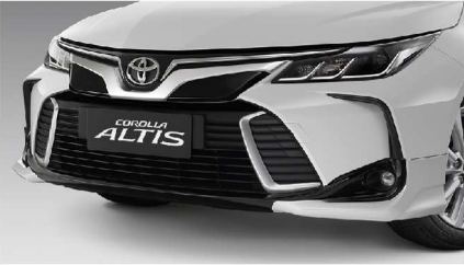
สเกิร์ตกันชนหน้า