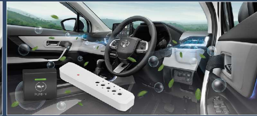
เครื่องฟอกอากาศในรถยนต์ (แบบปล่อยประจุ) พร้อมไฟแสดงสถานะอากาศ