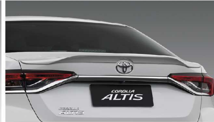
สปอยเลอร์หลัง