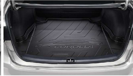
ถาดใส่ของท้ายรถ