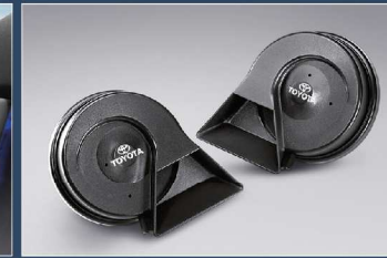
ชุดสัญญาณแตร