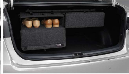
กล่องแขวนอนกประสงค์ท้ายรถ