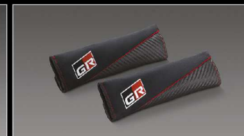
ปลอกหุ้มเข็มขัดนิรภัย GR

อุปกรณ์ตกแต่งแท้โตโยต้ารับประกันสูงสุด 3 ปี หรือ 100,000 กม.