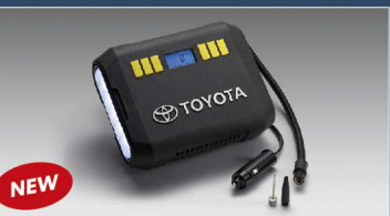
ชุดอุปกรณ์เติมลมยาง (แบบดิจิทัล) Ver.2