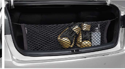
ตาข่ายเก็บของท้ายรถ