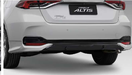
สเกิร์ตกันชนหลัง