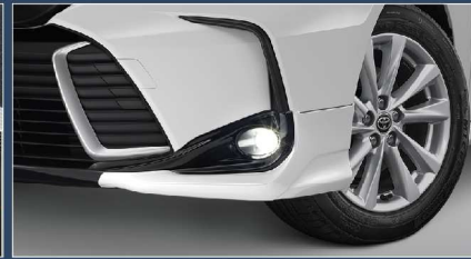
ชุดไฟตัดหมอกแอลอีดี