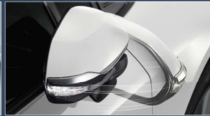
ชุดควบคุมระบบพับกระจกอัตโนมัติ