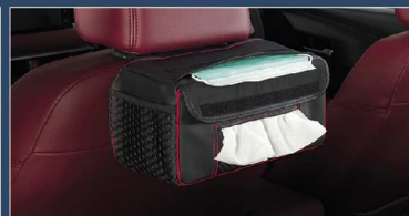
ผ้าคลุมกล่องกระดาษทิชชู พร้อมที่ใส่หน้ากากอนามัย