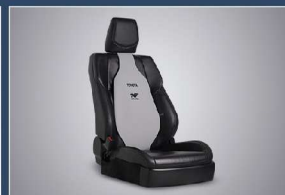
เบาะรองหลังเพื่อสุขภาพ