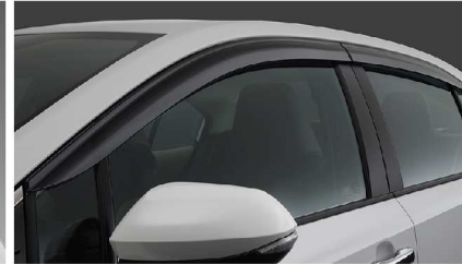
แผงบังแดดข้าง