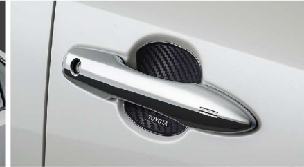
กรอบรองที่จับประตูลายเคฟล่า