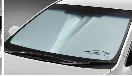
ที่บังแดดด้านหน้า