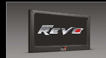
กรอบป้ายทะเบียน GR