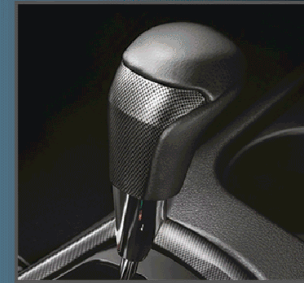
หัวเกียร์หลายสปอร์ต (เกียร์อัตโนมัติ)