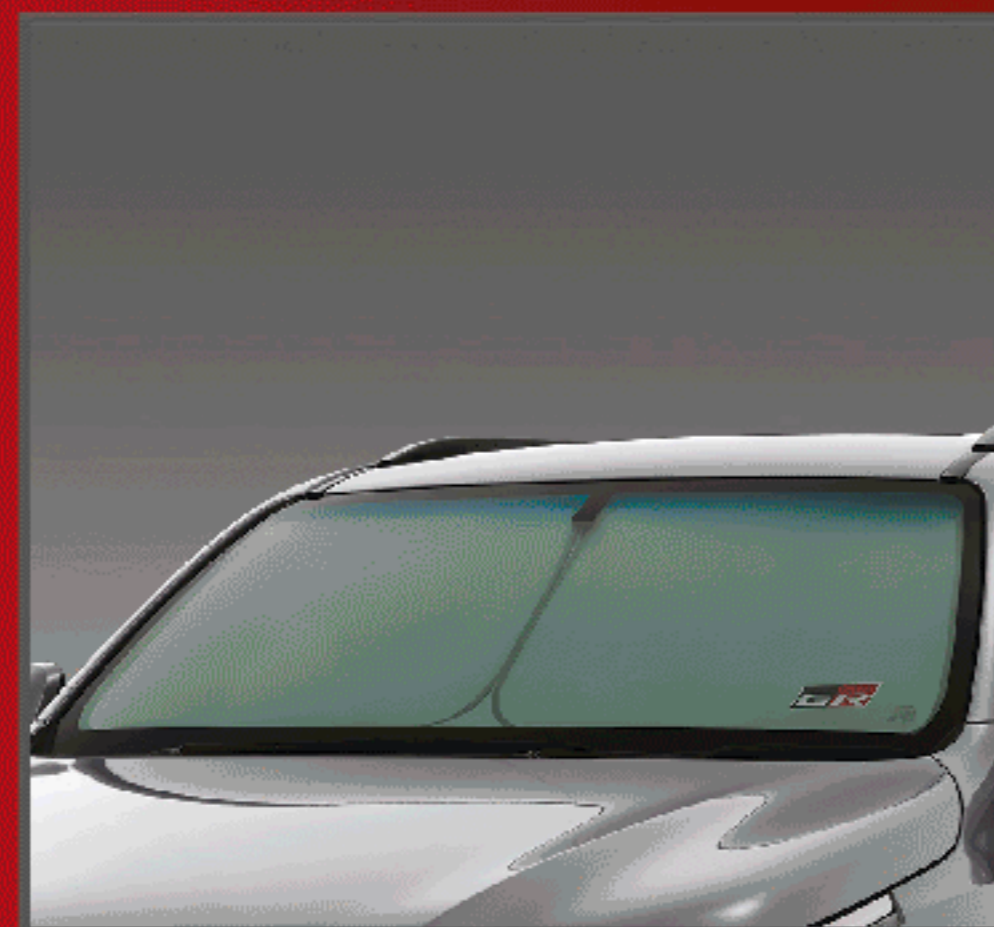
ที่บังแดดด้านหน้า GR