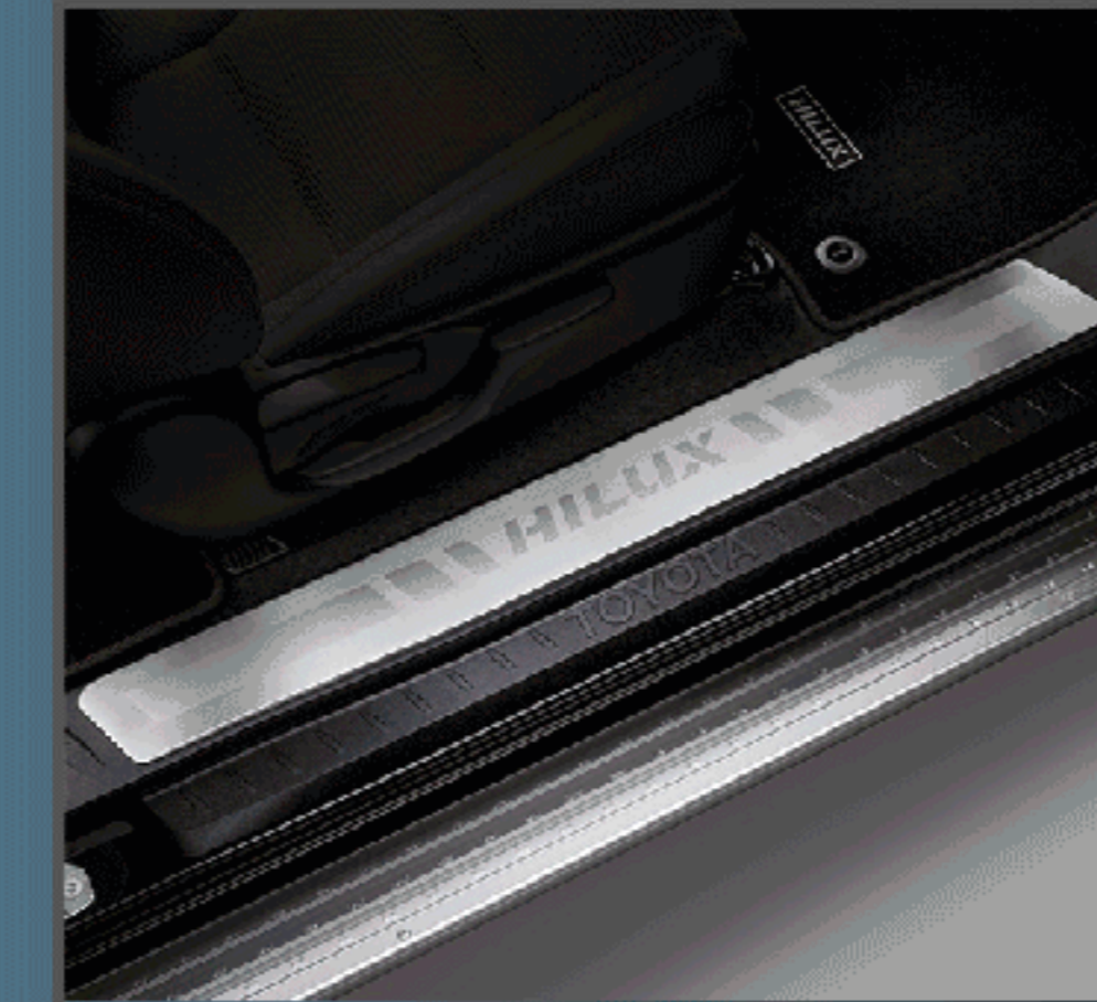
สคิปไฟพลก รุ่นสมาร์ก แเค็บ