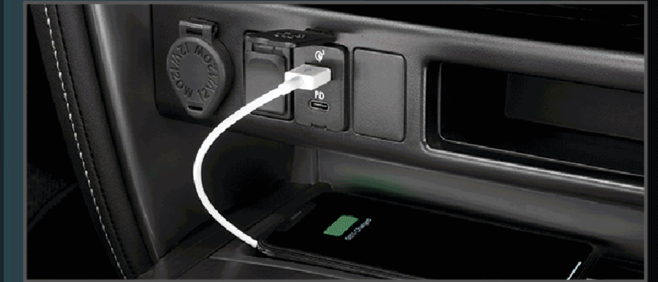
ที่ชาร์จภายในรถยนต์ (USB)