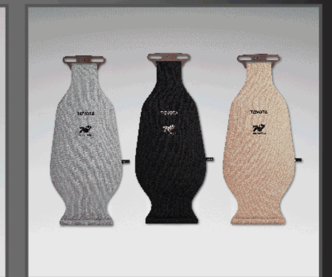
เบาะรองหลังเพื่อสุขภาพ

อุปกรณ์ตกแต่งแท้โตโยต้ารับประกันสูงสุด 3 ปี หรือ 100,000 กม. (ตามรุ่นรถยนต์ที่บริษัทฯ กำหนด โปรดศึกษารายละเอียดจากคู่มือรับประกันคุณภาพ และคู่มือการใช้งานรถยนต์)