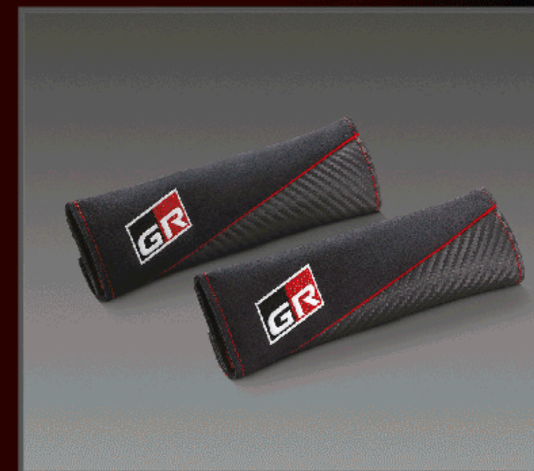
ปลอกหุ้มเข็มขัดนิรภัย GR