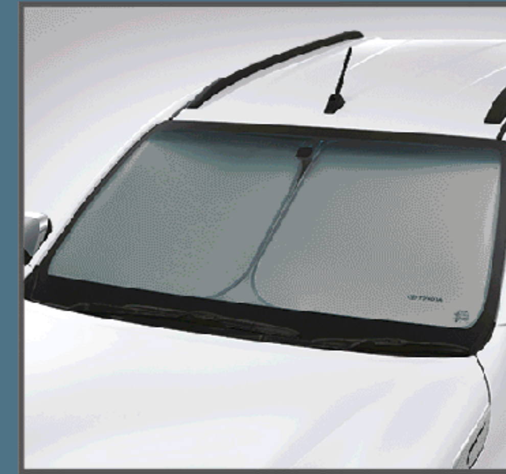
ที่บังแดดด้านหน้า