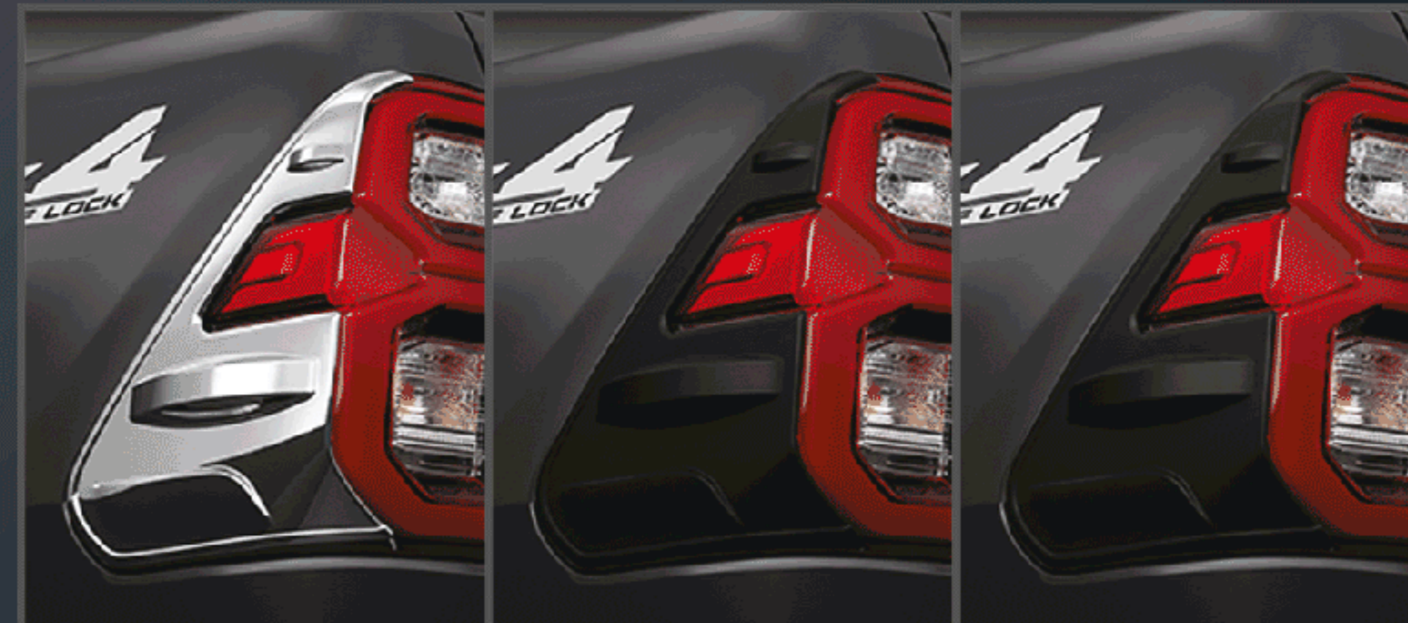
คิ้วไฟท้าย LED (โครเมียม / สีดำด้าน / สีเทาเข้ม)