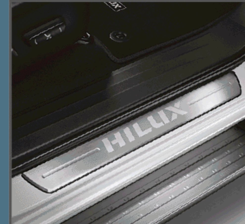
สคิปไฟพลก รุ่นดับเบิล แเค็บ