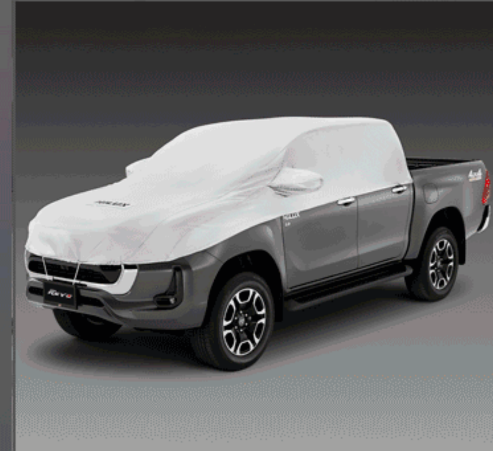
ผ้าคลุมรถแบบครึ่งคัน