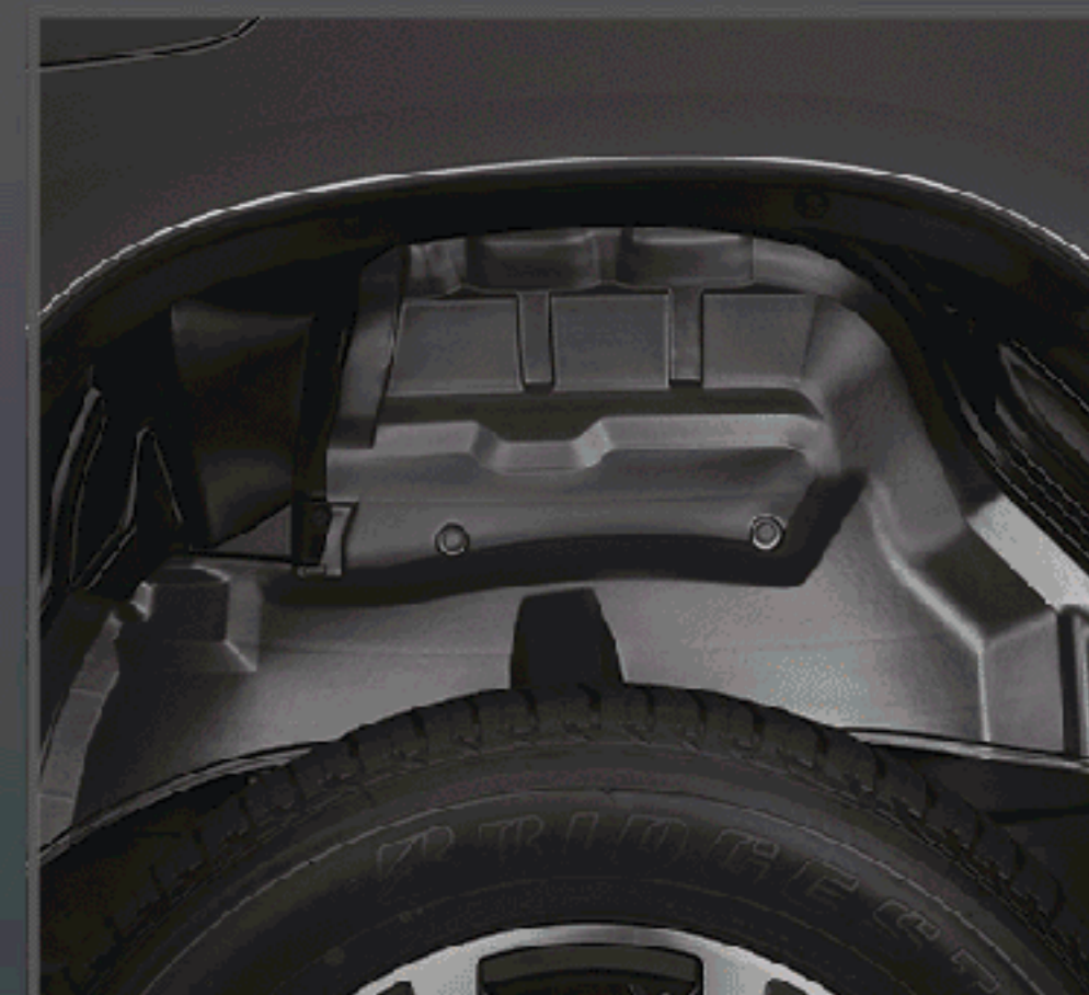
ชุดกันโคลนขุมล้อ