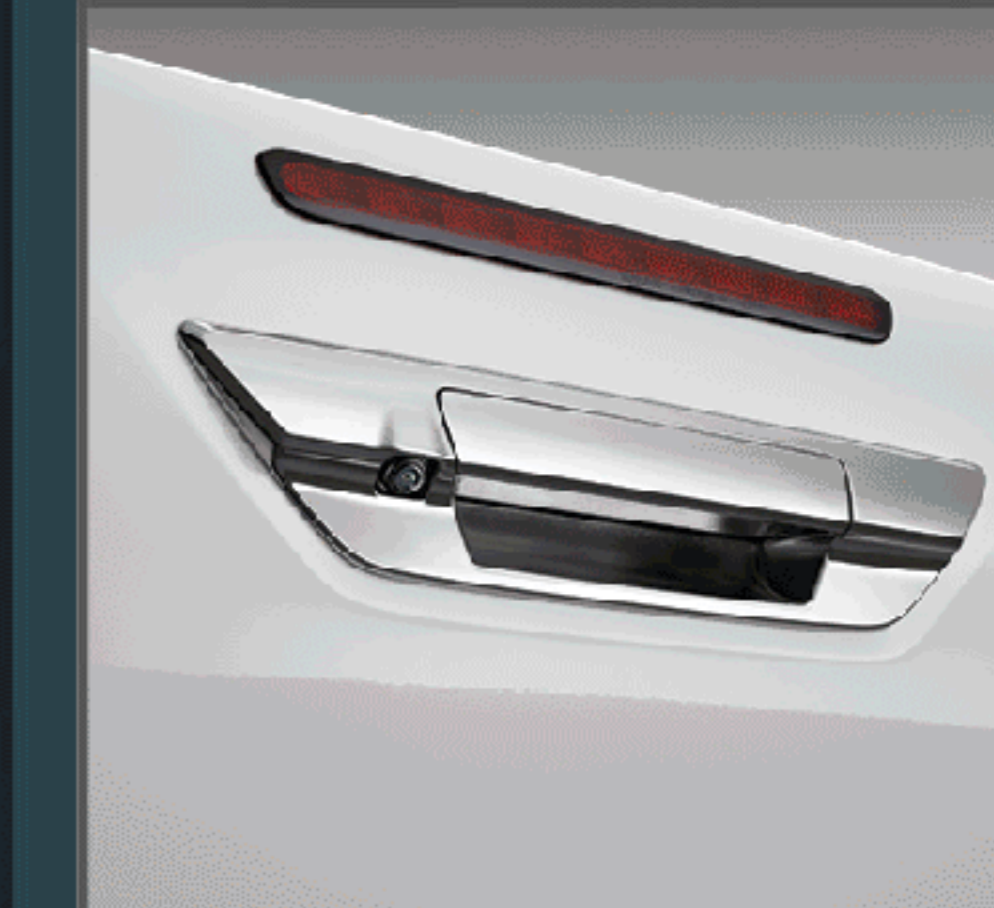
กล้องมองหลัง