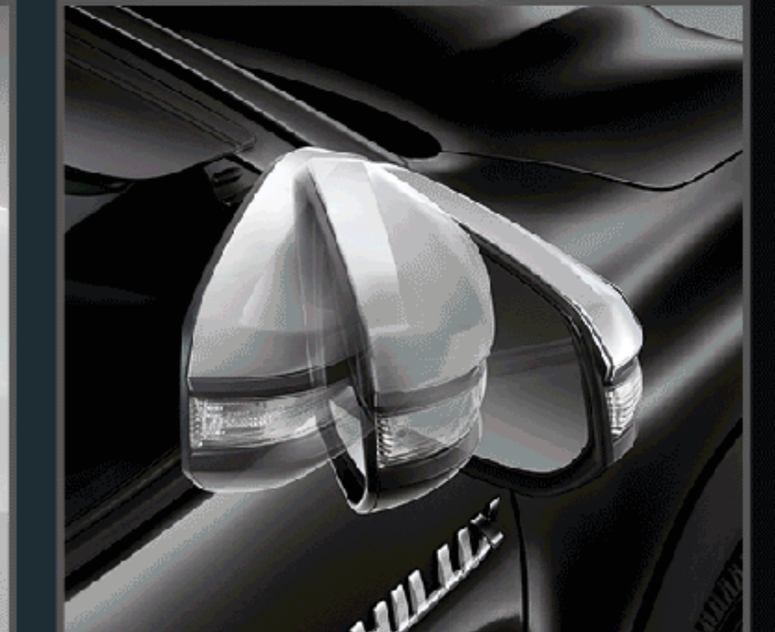
ชุดควบคุมระบบพินกระจกอัตโนมัติ