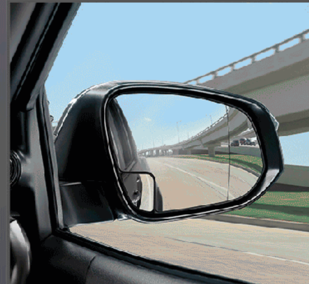
กระจกข้างช่วยมองมุมอับสายตา