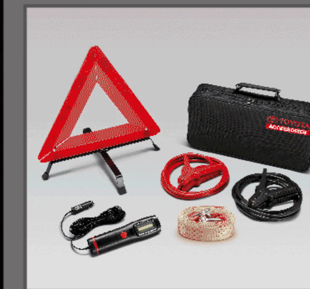
ชุดอุปกรณ์ฉุกเฉิน (แบบกระเป๋าดำ)