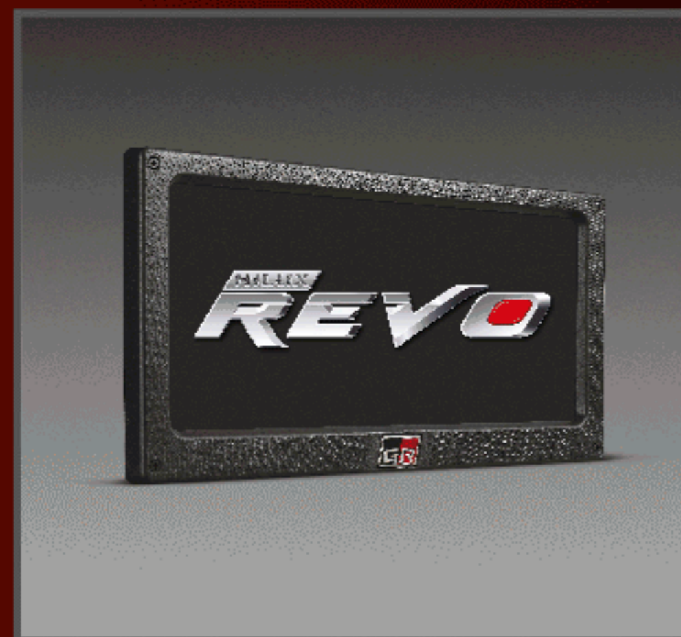
กรอบป้ายทะเบียน GR