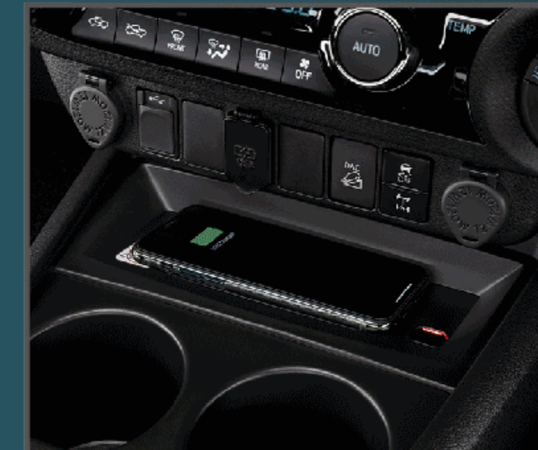
อุปกรณ์ชาร์จไฟแบบไร้สาย