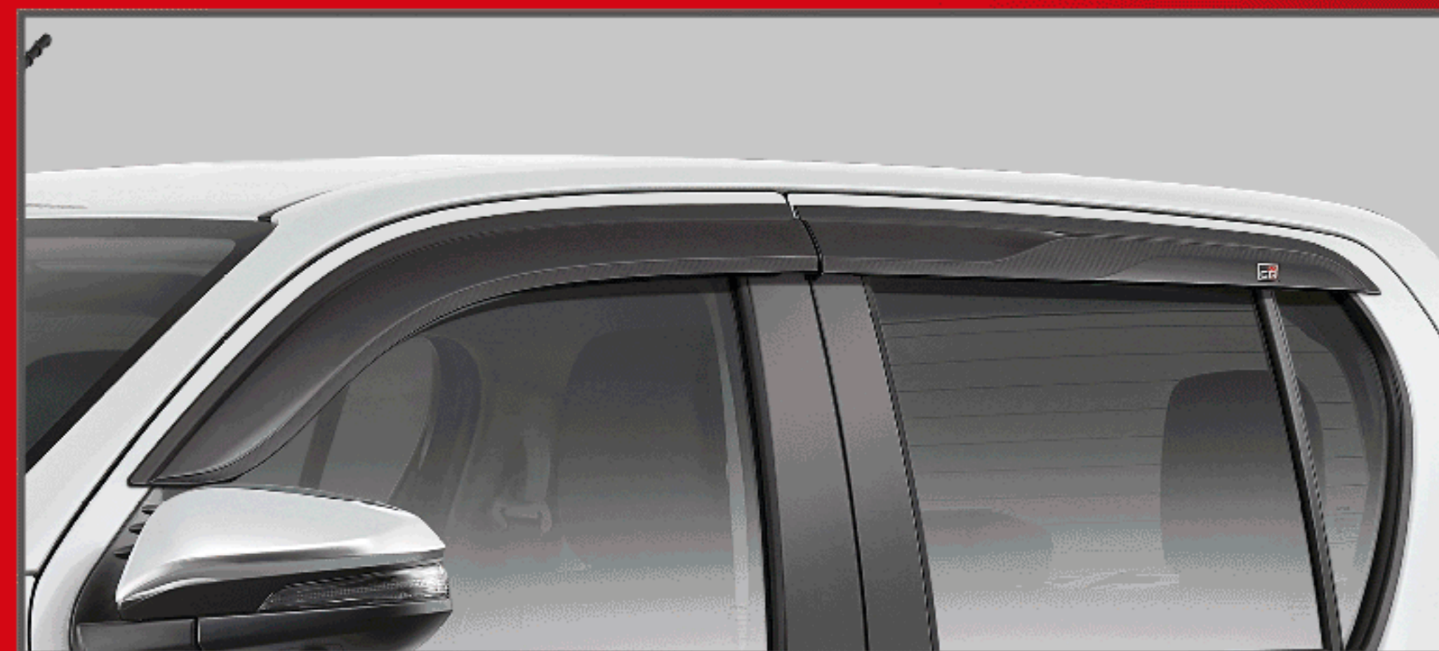
แผงบังแดดข้าง GR รุ่นดับเบิล แเค็บ