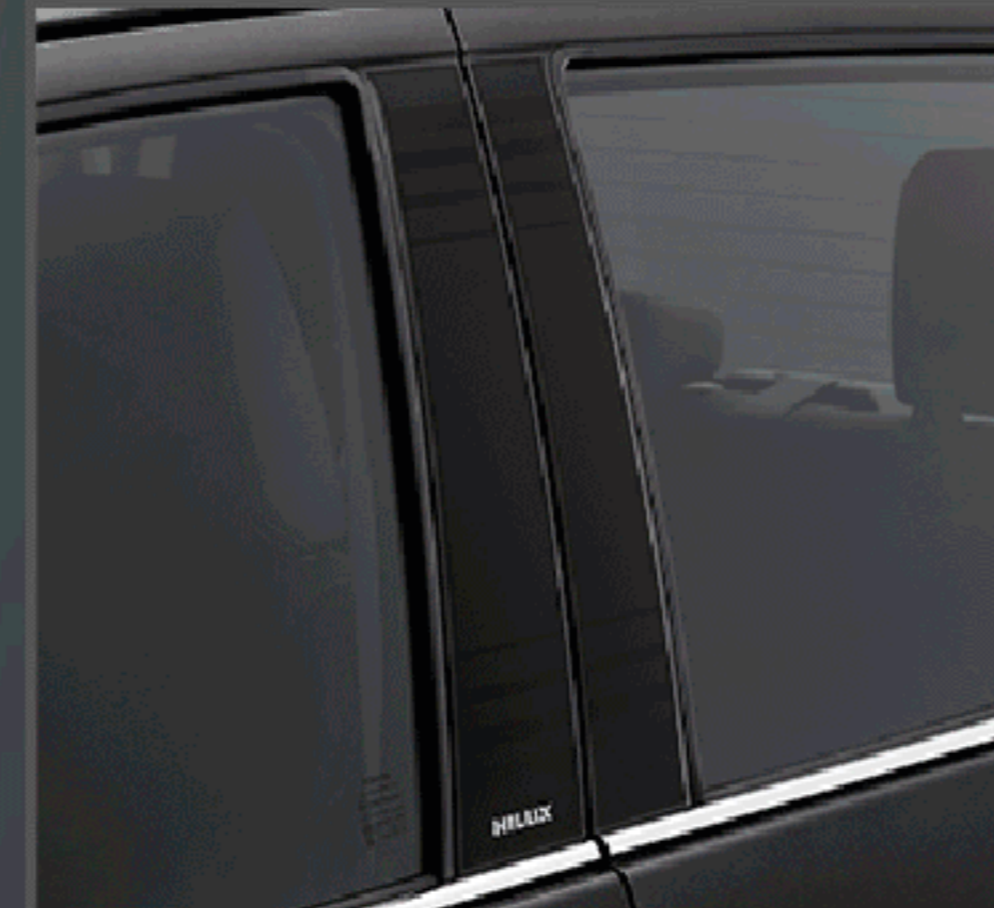
สติ๊กเกอร์ตกแต่งเสาประตู รุ่นดับเบิล แเค็บ