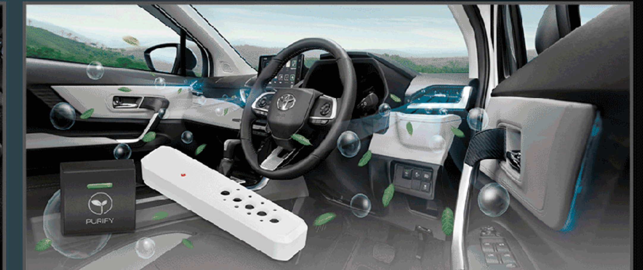
เครื่องฟอกอากาศในรถยนต์(แบบปล่อยประจุ) พร้อมไฟแสดงสถานะอากาศ