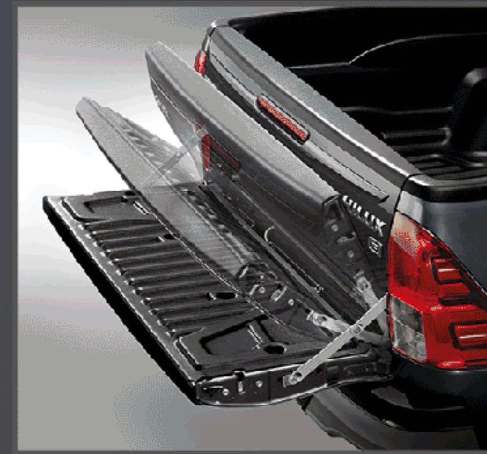
อุปกรณ์ช่วยผ่อนแรงเปิด-ปิด ฝาท้ายกระบะ