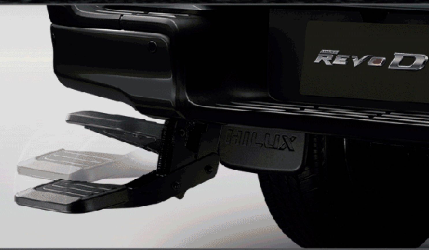
บันไดท้ายแบบพับได้