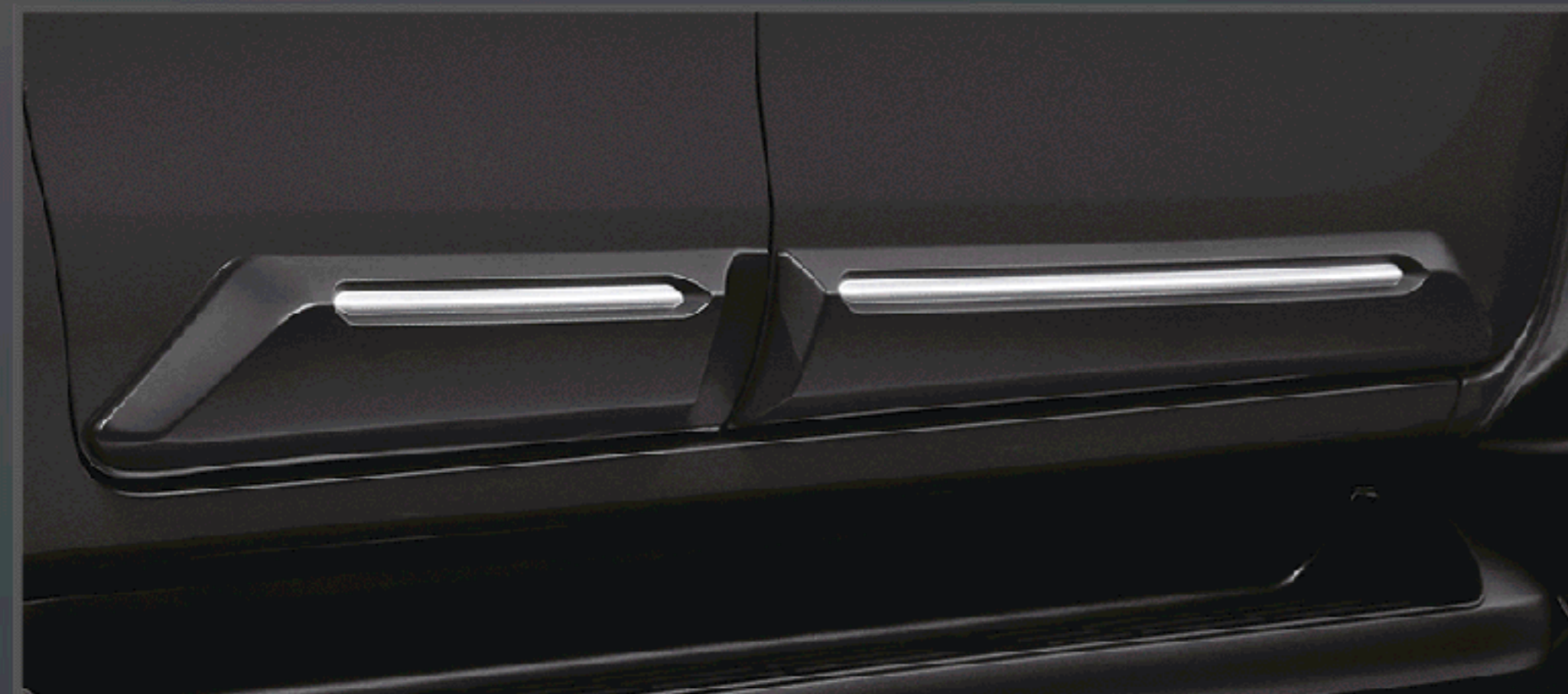
คิ้วกันกระแทกประตู (สีเงิน) รุ่นดับเบิล แเค็บ