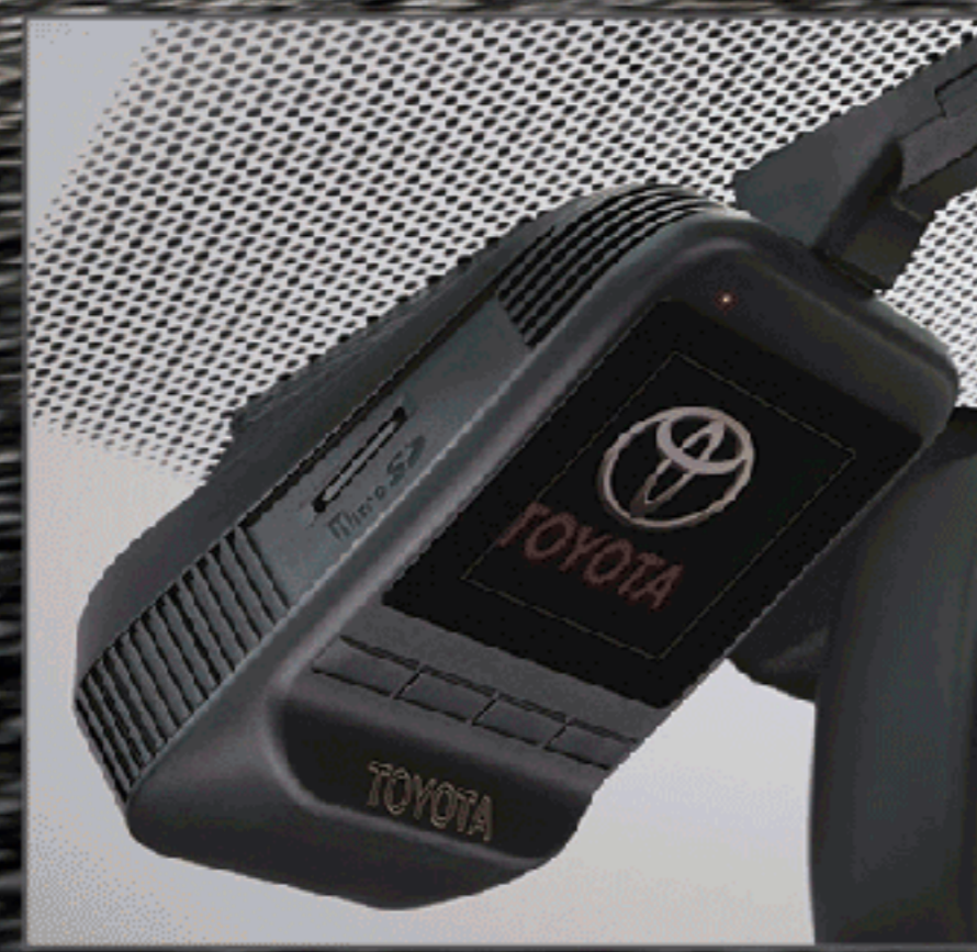
กล้องบันทึกภาพด้านหน้าและหลัง