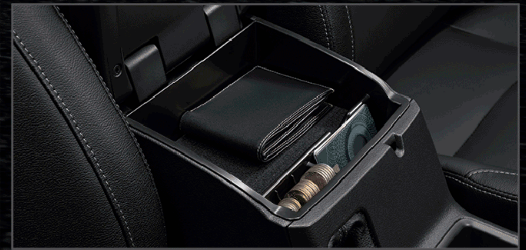
กล่องเก็บของที่วางแขน

อุปกรณ์ตกแต่งแท้โตโยต้ารับประกันสูงสุด 3 ปี หรือ 100,000 กม. (ตามรุ่นรถยนต์ที่บริษัทฯ กำหนด โปรดศึกษารายละเอียดจากคู่มือรับประกันคุณภาพ และคู่มือการใช้งานรถยนต์)