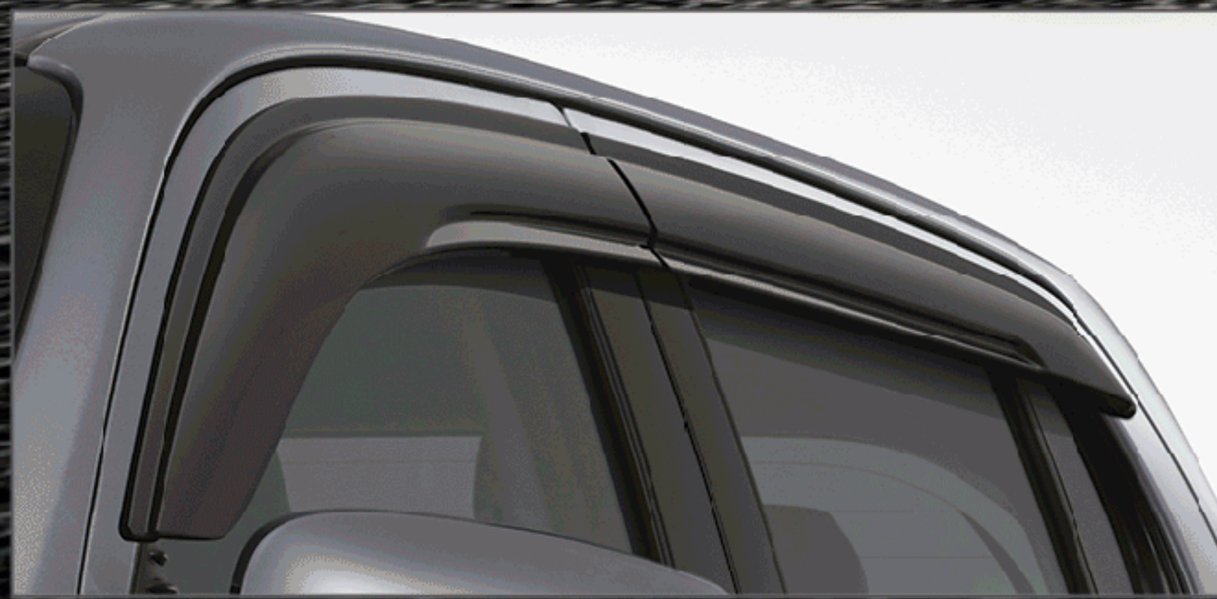
แผงบังแดดข้าง