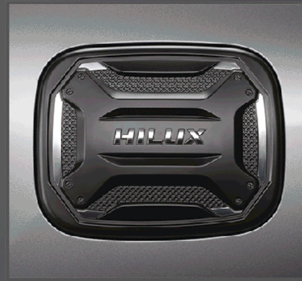
ชุดตกแต่งฝาถังน้ำมันโครเมียม