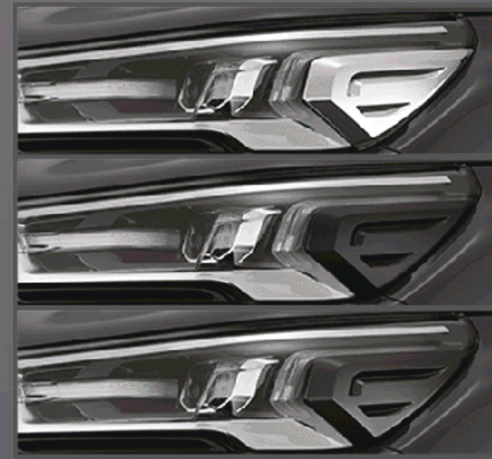
คิ้วไฟหน้า LED (โครเมียม / สีดำด้าน / สีเทาเข้ม)