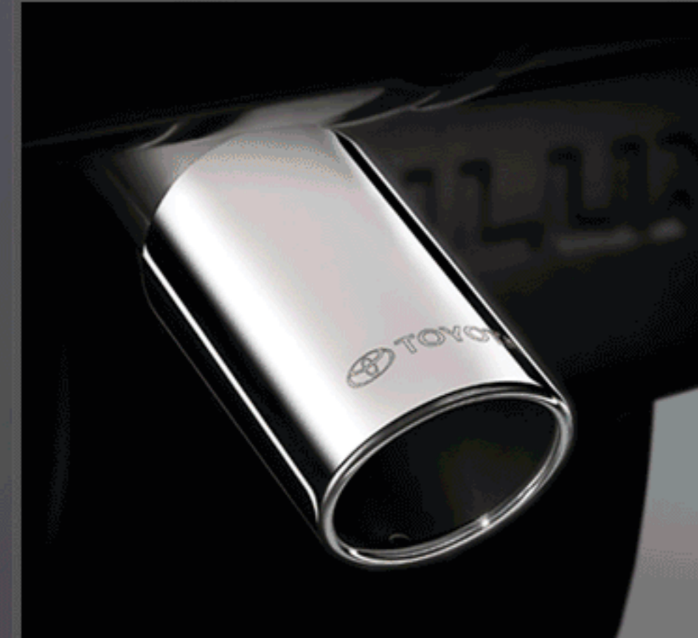
ปลายท่อไอเสียสแตนเลส