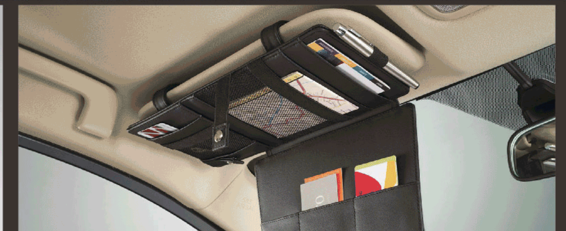
แผงบังแดดคอนนัทประสงค

อุปกรณ์ตกแต่งแท้โตโยต้ารับประกันสูงสุด 3 ปี หรือ 100,000 กม. (ตามรุ่นรถยนต์ที่บริษัทฯ กำหนด โปรดศึกษารายละเอียดจากคู่มือรับประกันคุณภาพ และคู่มือการใช้งานรถยนต์)