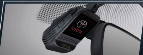
กล้องบันทึกภาพด้านหน้า