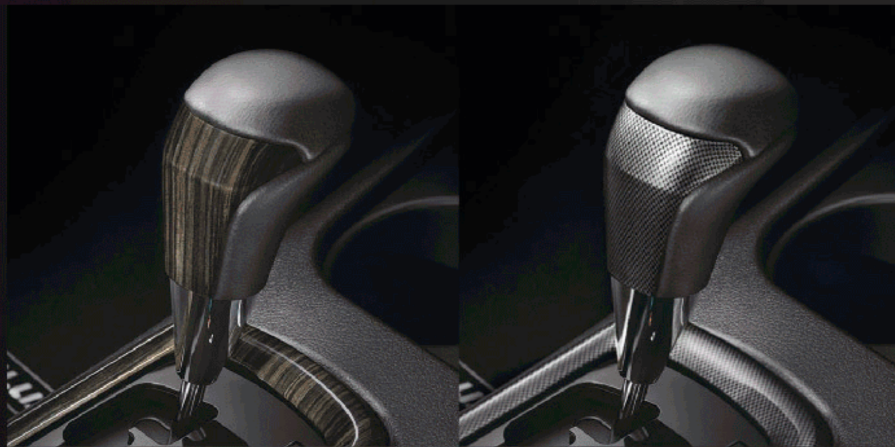
หัวเกียร์ลายไม้ / ลายสปอร์ต (เกียร์อัตโนมัติ)