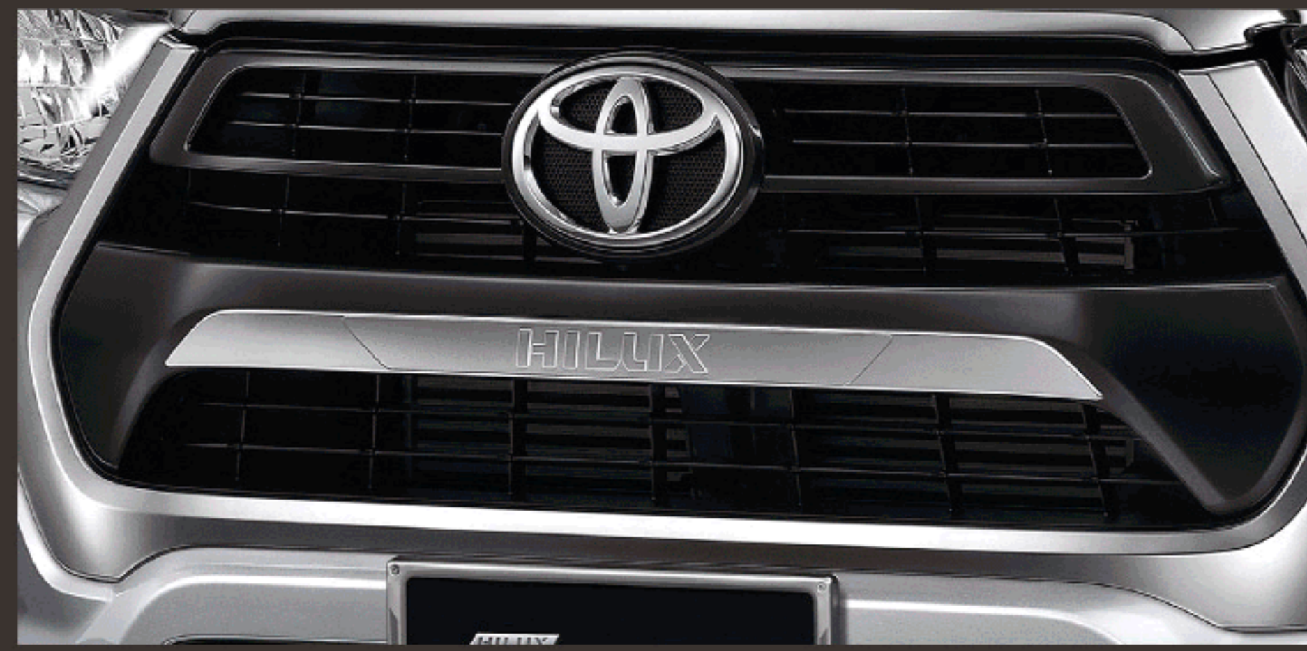
คิ้วกระจังหน้า (โครเมียม)