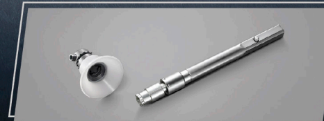
อุปกรณ์ล็อกยางอะไหล่ (แบบป้องกันการหมุน)

อุปกรณ์ตกแต่งแท้โตโยต้ารับประกันสูงสุด 3 ปี หรือ 100,000 กม. (ตามรุ่นรถยนต์ที่บริษัทฯ กำหนด โปรดศึกษารายละเอียดจากคู่มือรับประกันคุณภาพ และคู่มือการใช้งานรถยนต์)