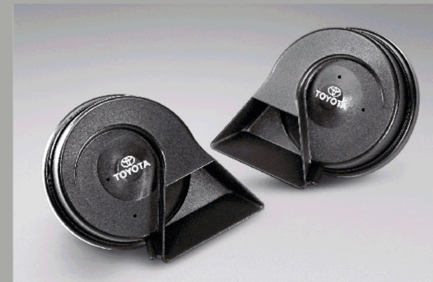
ชุดสัญญาณแตร