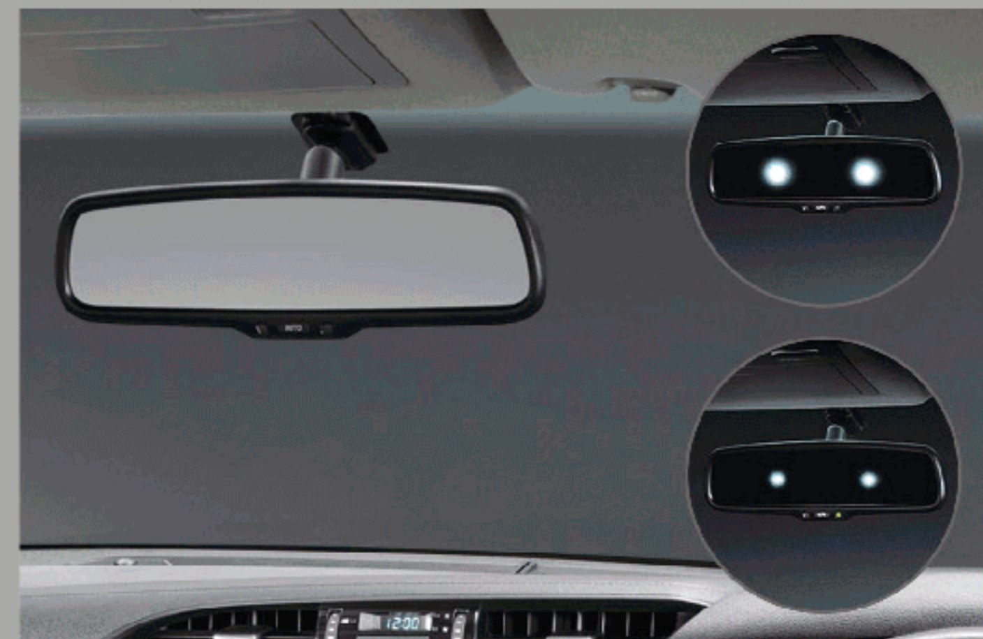
กระจกมองหลังลดแสงสะท้อนอัตโนมัติ