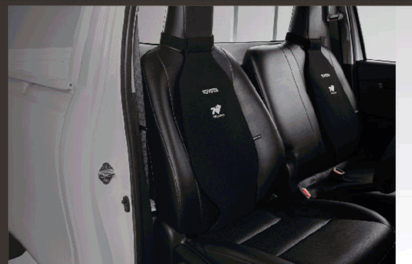
เบาะรองหลังแบบสายรัด (สีดำ)