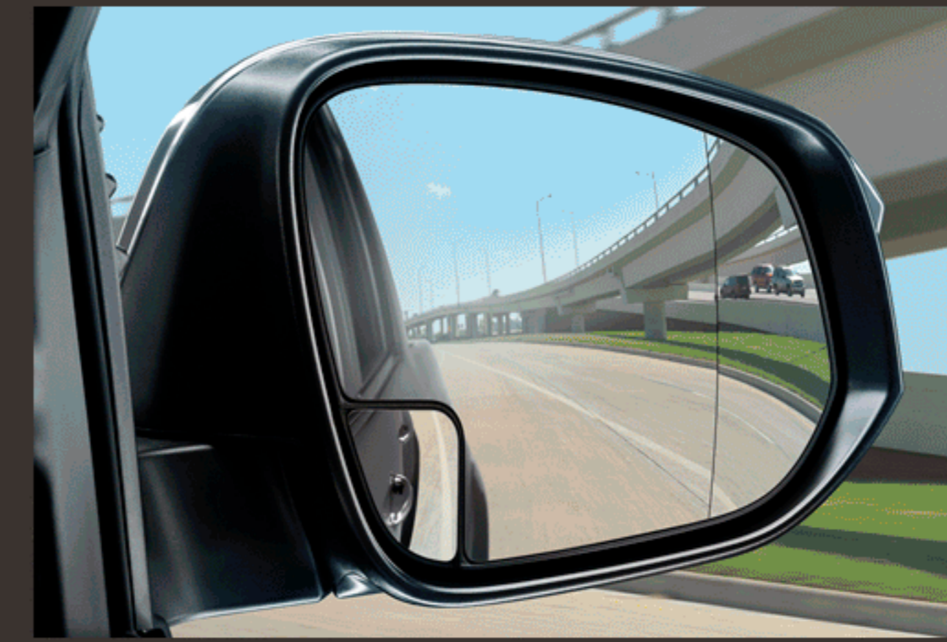
กระจกข้างช่วยมองเห็นมุมอับสายตา