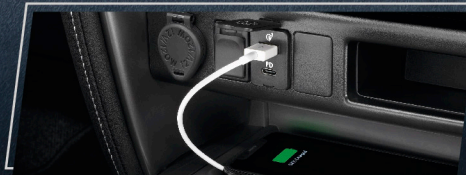
ที่ชาร์จภายในรถยนต์ (USB)