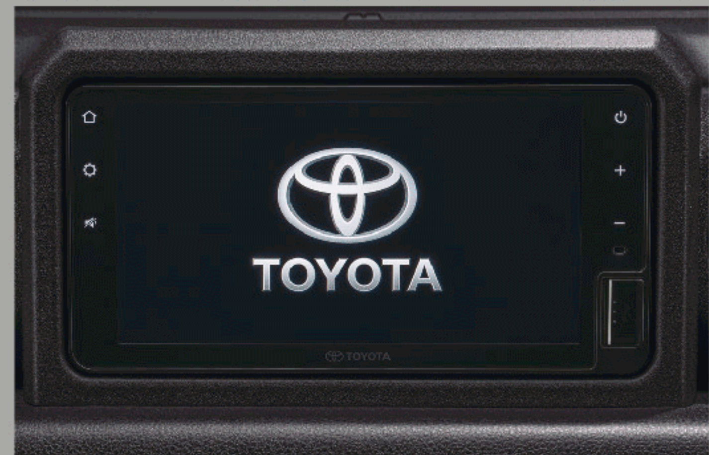
เครื่องเล่นวิทยุหน้าจอ 7 นิ้ว