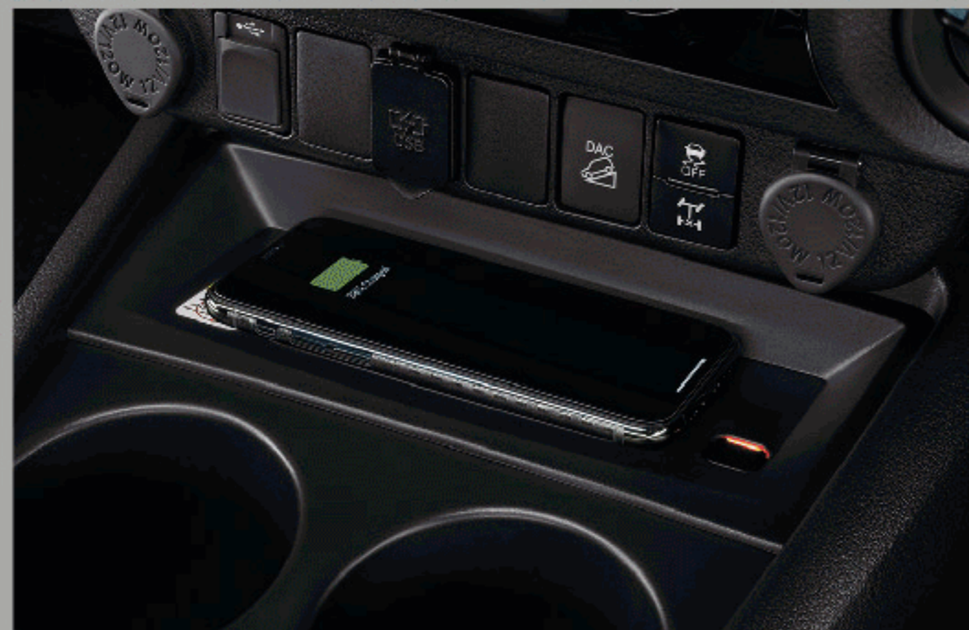
อุปกรณ์ชาร์จไฟแบบไร้สาย