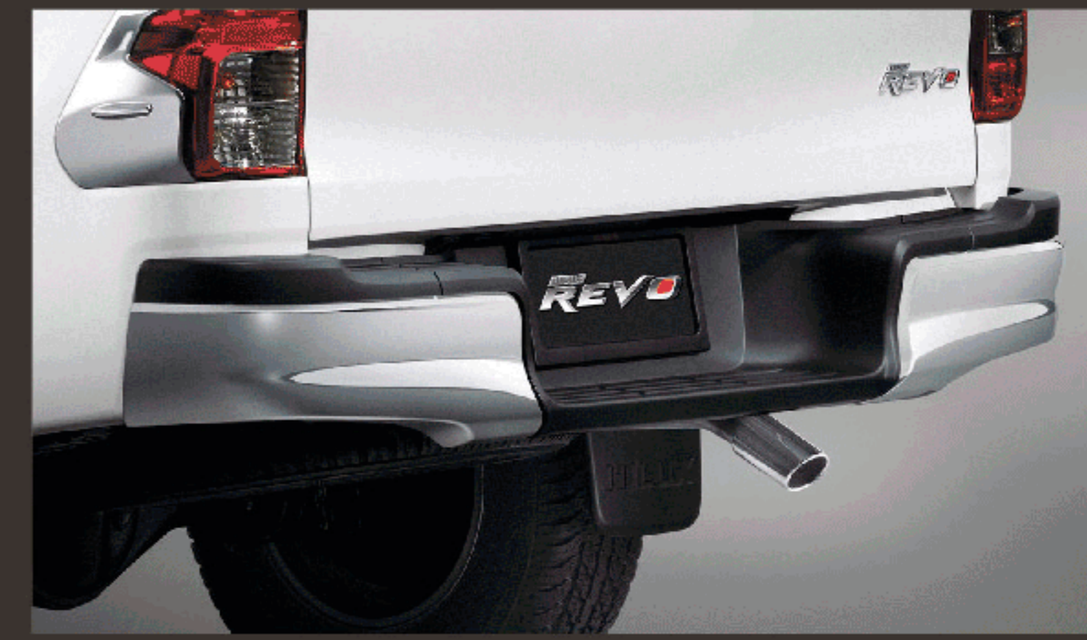
กันชนหลัง