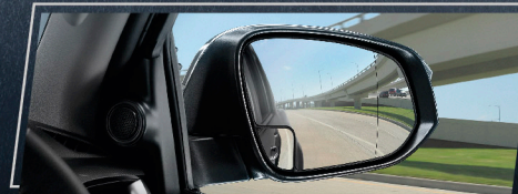
กระจกข้างช่วยมองมุมอับสายตา