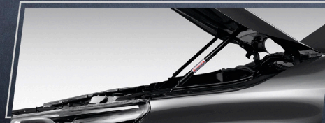
อุปกรณ์ช่วยผ่อนแรง เปิด-ปิดฝากระโปรงหน้า