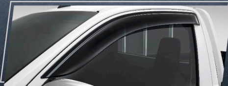
แผงบังแดดข้าง

รุ่นมาตรฐาน ขับเคลื่อน 2 ล้อ 2.4 Entry MT