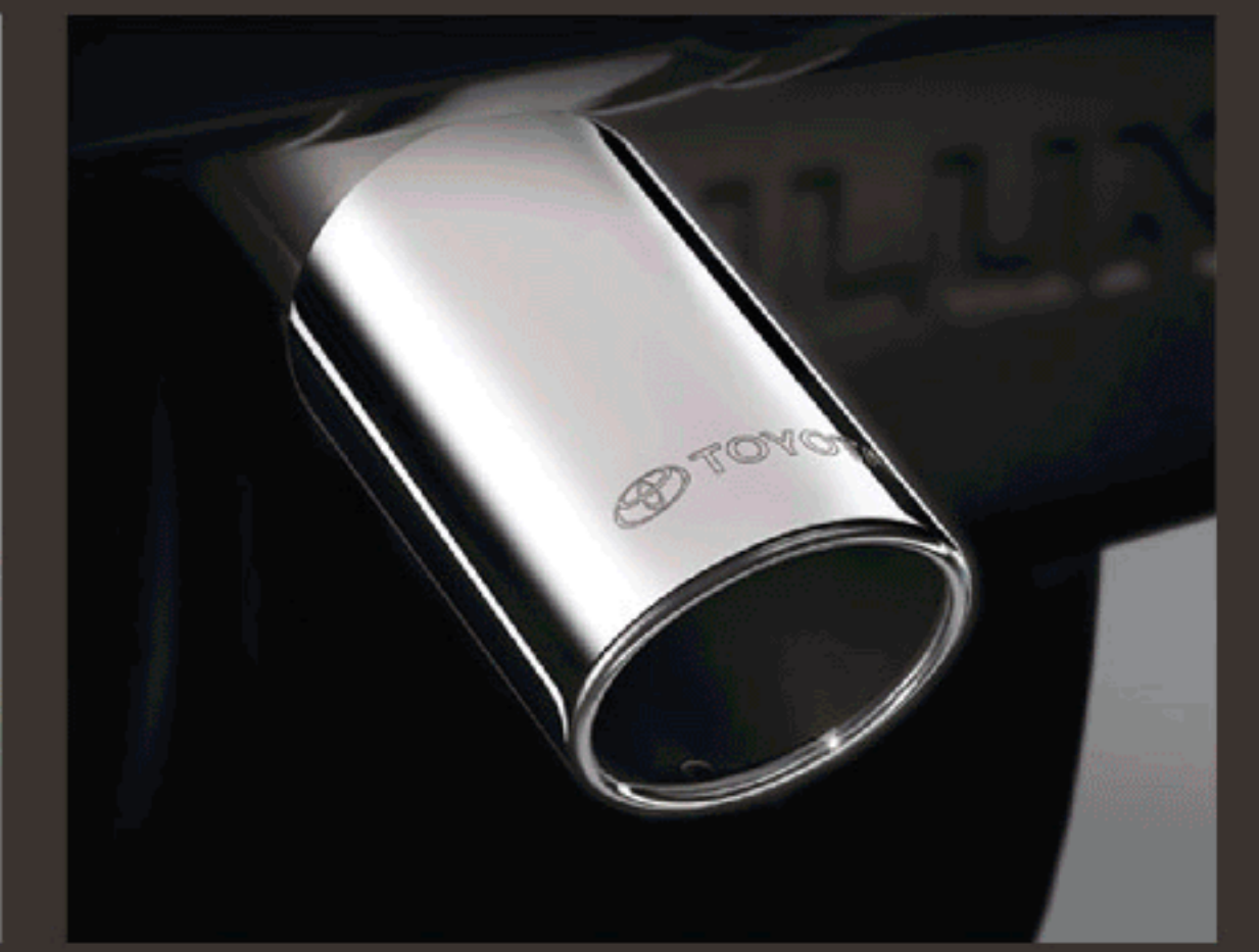
ปลายท่อไอเสียสแตนเลส