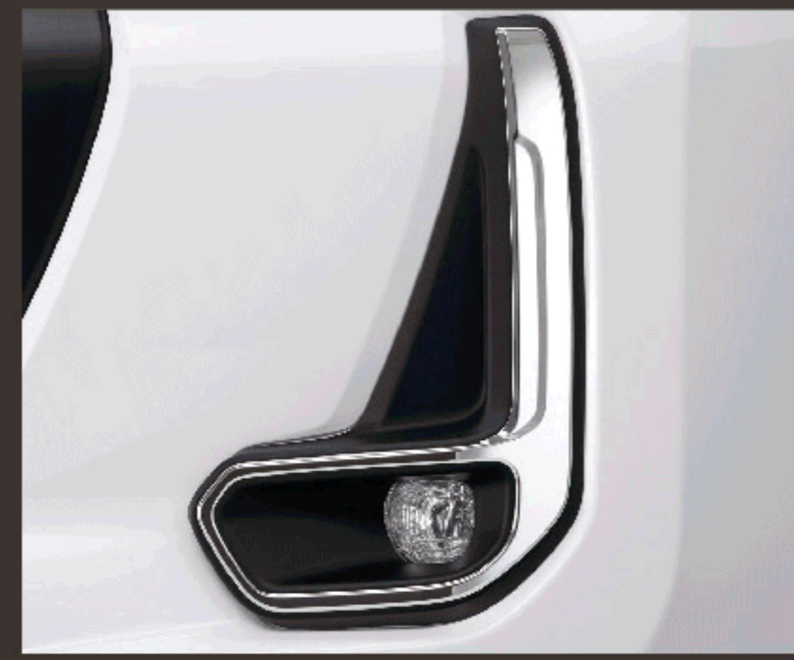
กรอบไฟตัดหมอกโครเมียม