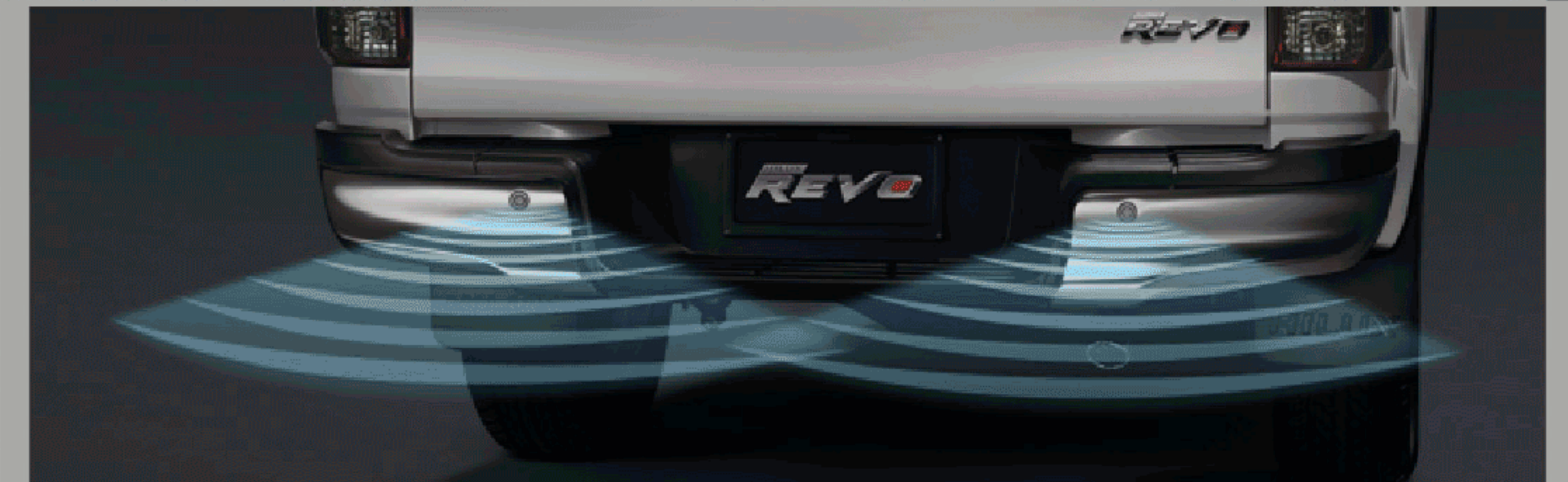
สัญญาณเตือนกะระยะท้ายรถ