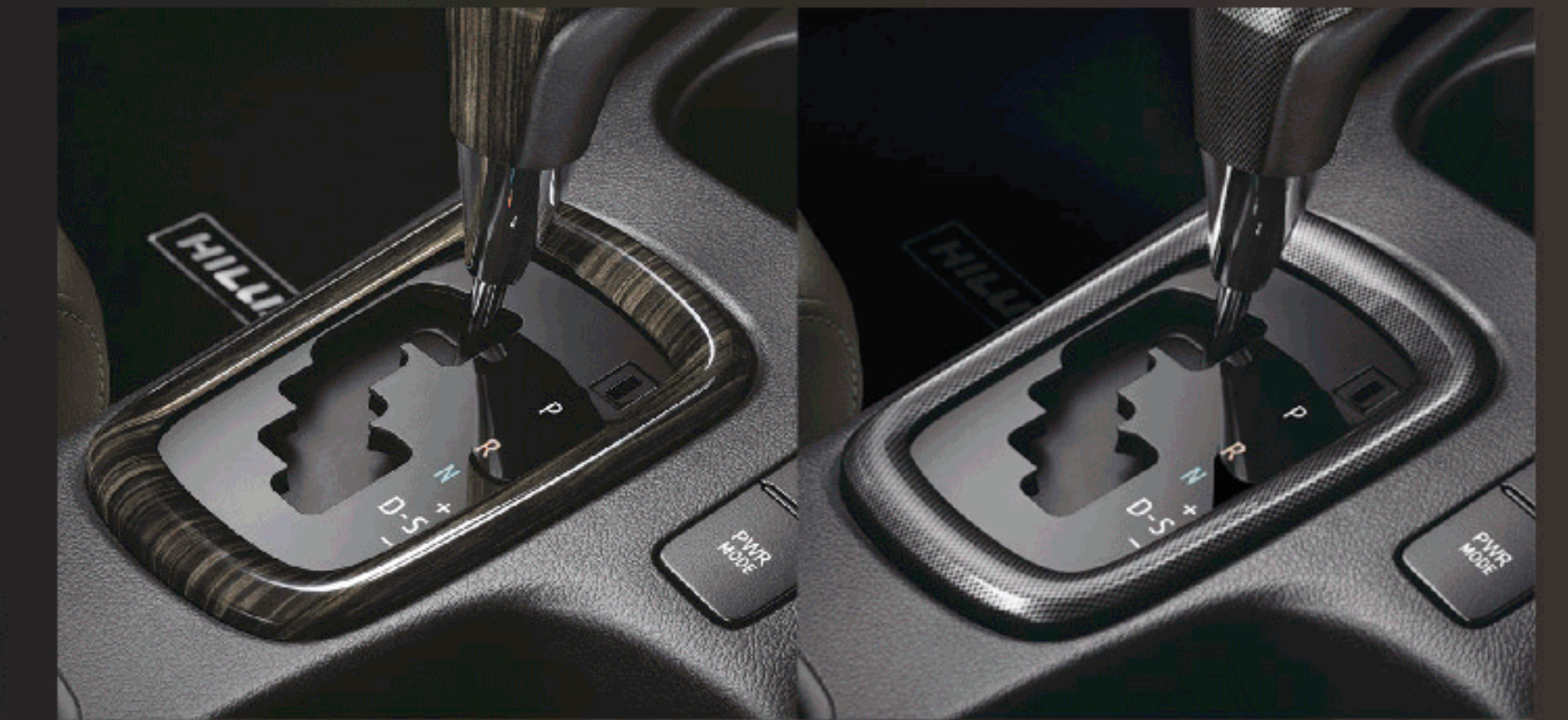
ที่รอบฐานเกียร์ลายไม้ / ลายสปอร์ต (เกียร์อัตโนมัติ)