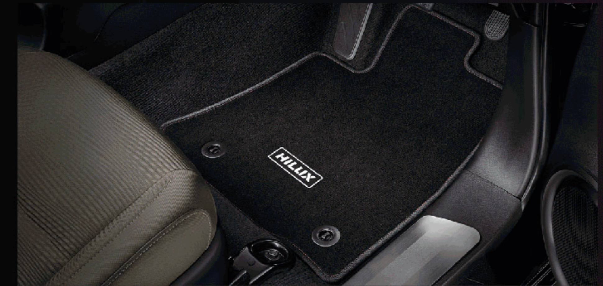
พรมปูพื้นรถยนต์ (เกียร์ธรรมดา)