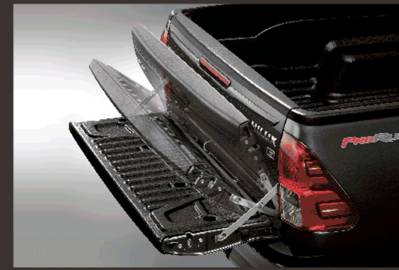
อุปกรณ์ช่วยผ่อนแรงเปิด - ปิดฝาท้ายกระบะ