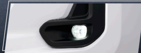
ชุดไฟตัดหมอก LED