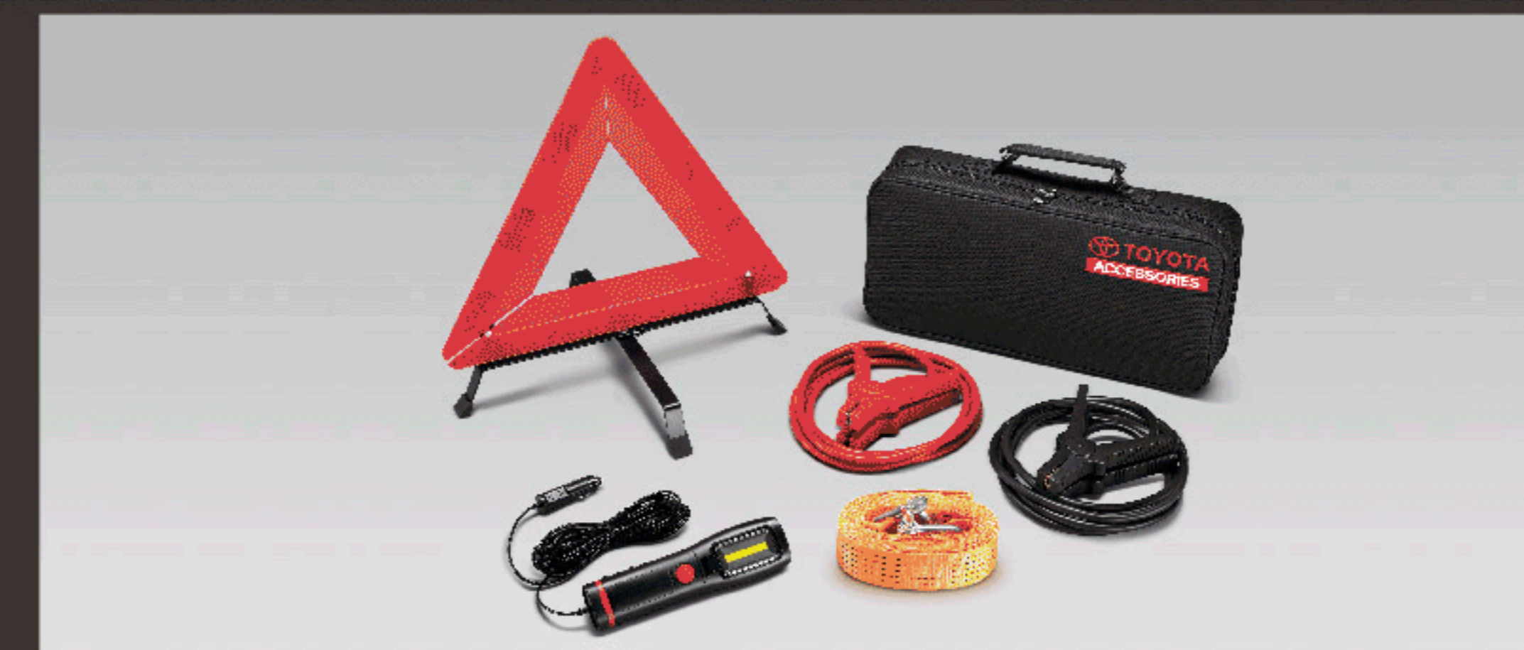
ชุดอุปกรณ์ฉุกเฉิน (แบบกระเป๋าผ้า)