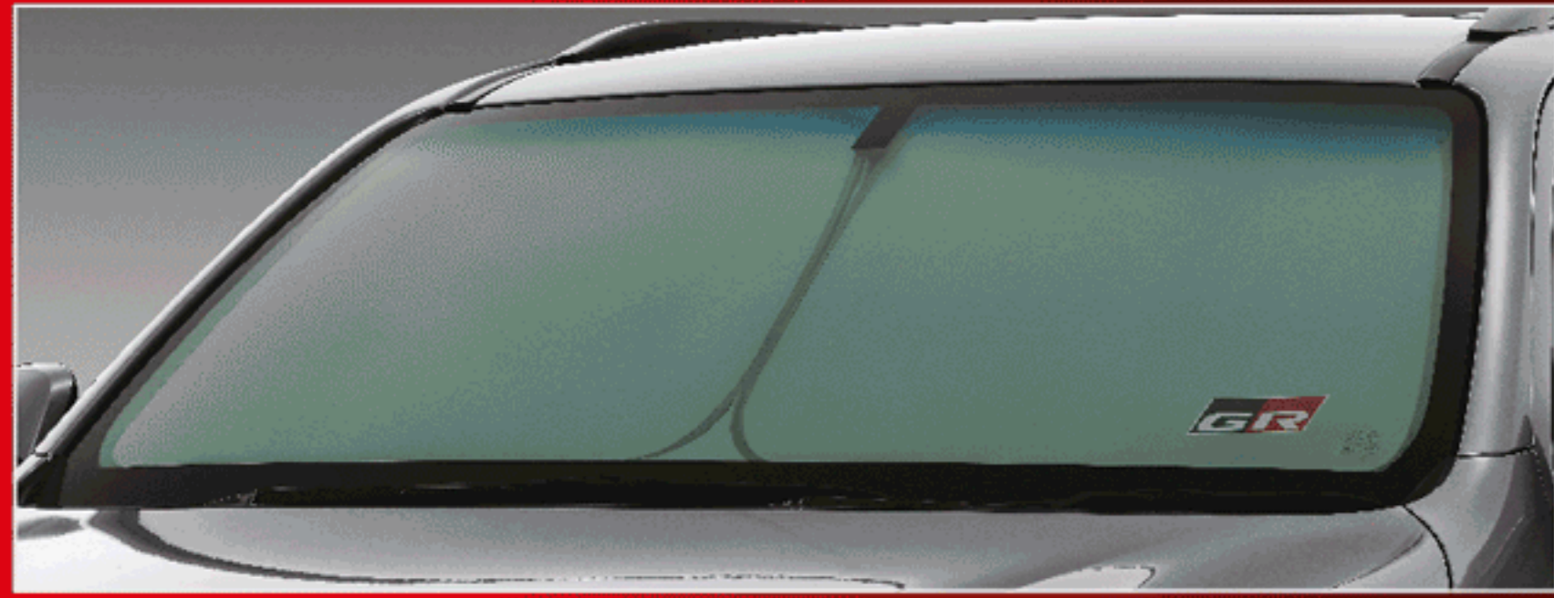
ที่บังแดดด้านหน้า GR