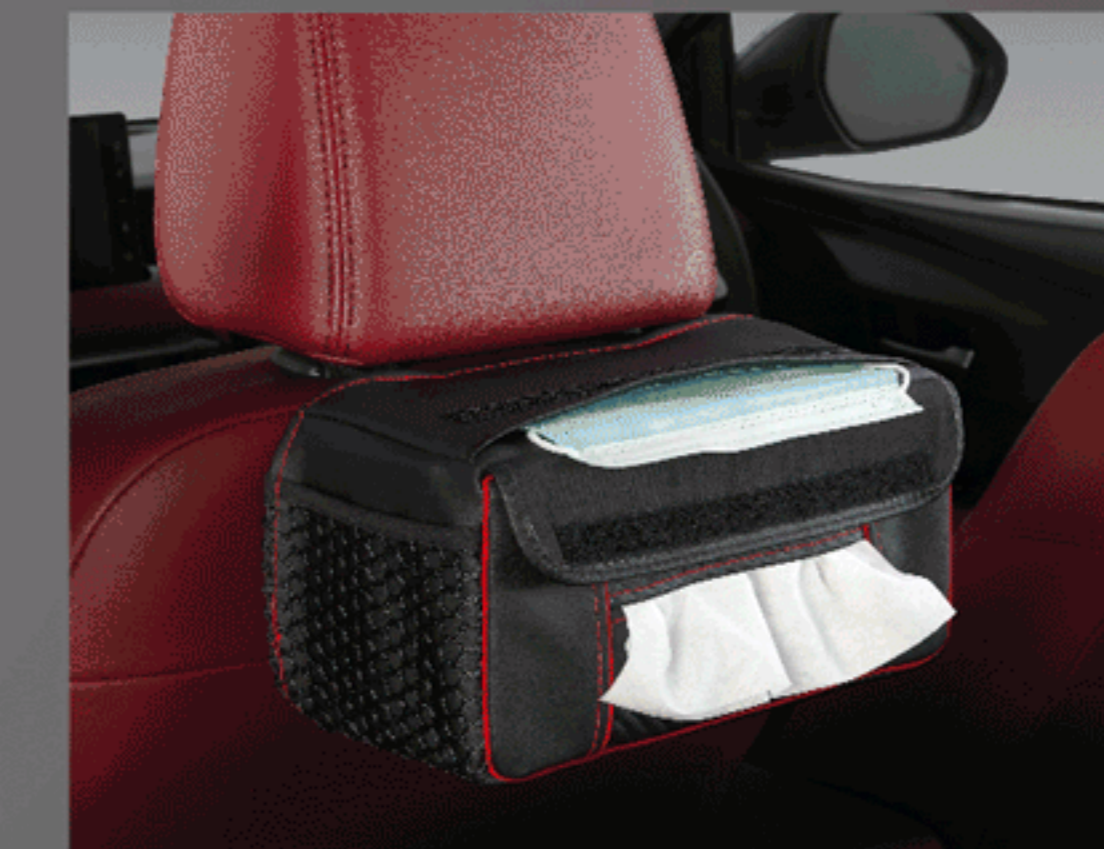
ผ้าคลุมกล่องกระดากิซซู พร้อมที่ใส่หน้ากากอนามัย