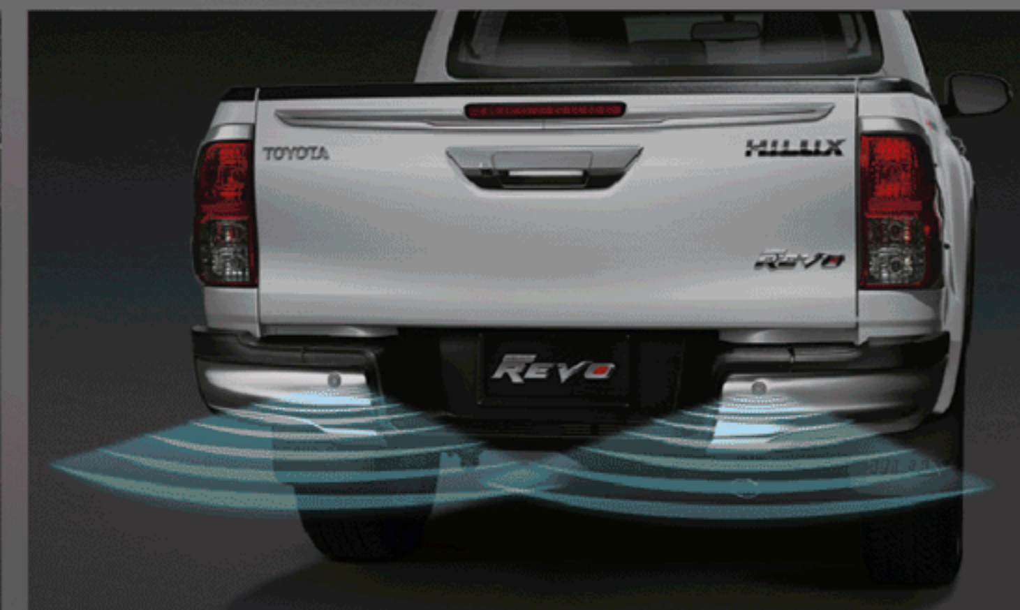
สัญญาณเตือนกระแทกท้ายรถ