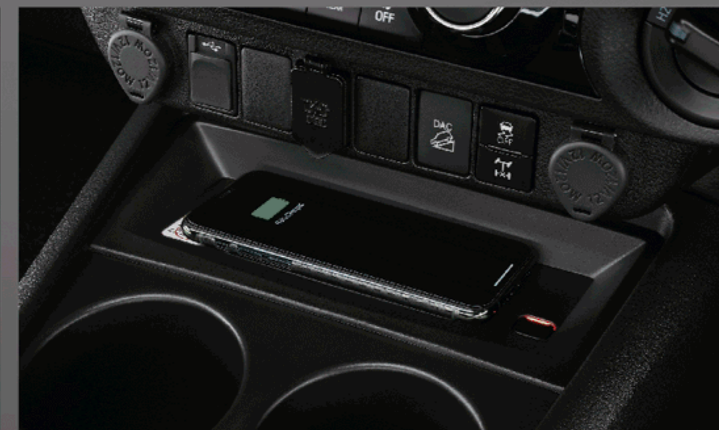
อุปกรณ์ชาร์จไฟแบบไร้สาย