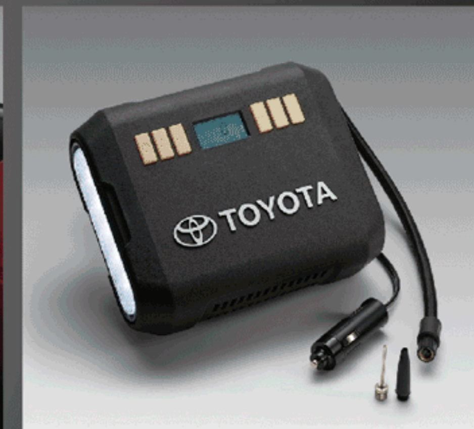
ชุดอุปกรณ์เต็มมยาง (แบบดิจิทัล) ver. 2