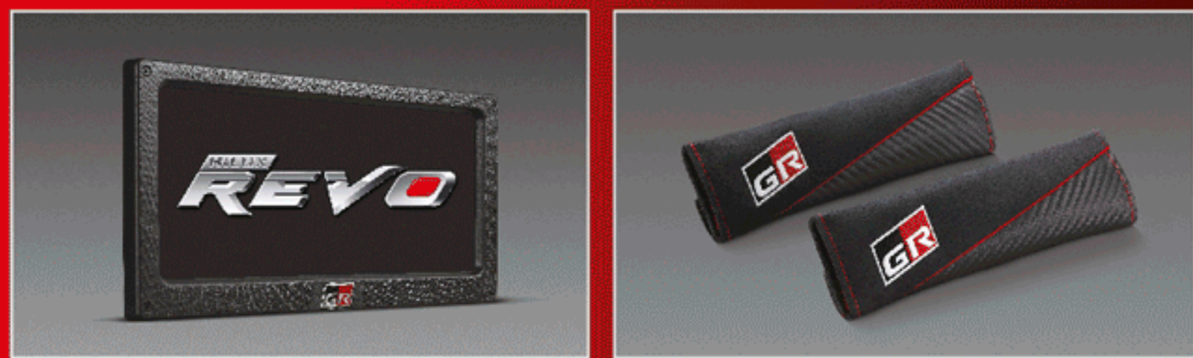
กรอบป้ายทะเบียน GR ปлокหุ้มเข็มขัดนิรภัย GR