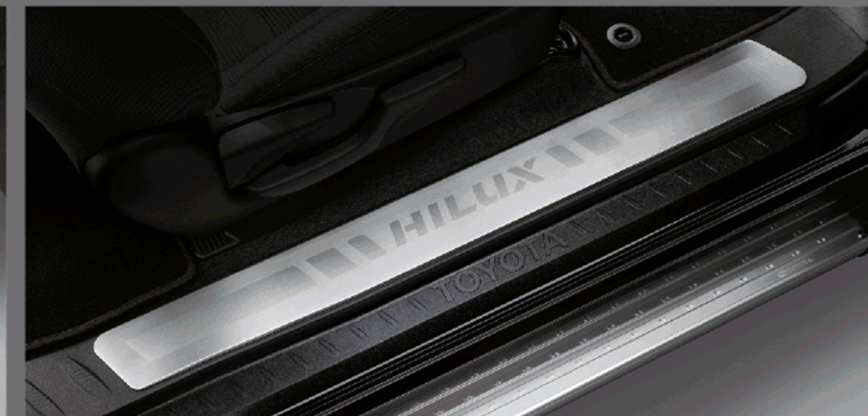
สคัฟิวลา รุ่นสมาร์ท แค็บ