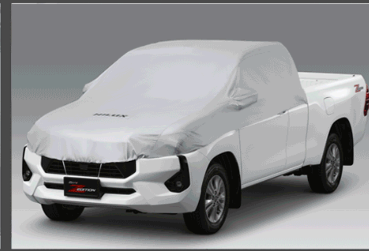
ผ้าคลุมรถแบบครึ่งคัน (C-CAB)