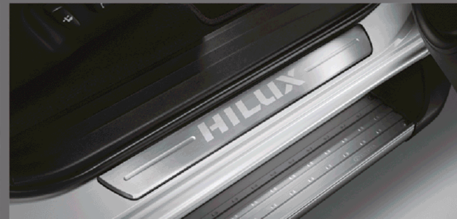
สคัฟิวลา รุ่นดับเบิล แค็บ