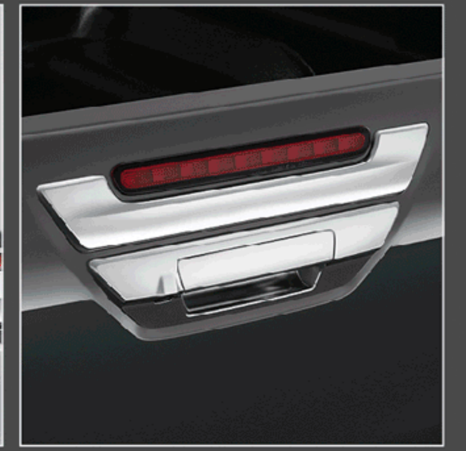
คิ้วไฟเบรกดวงที่สามโครเมียม