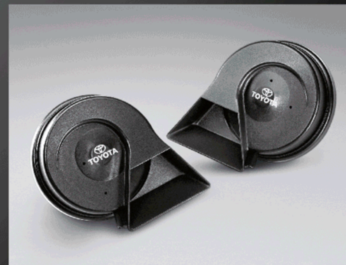
ชุดสัญญาณแตร