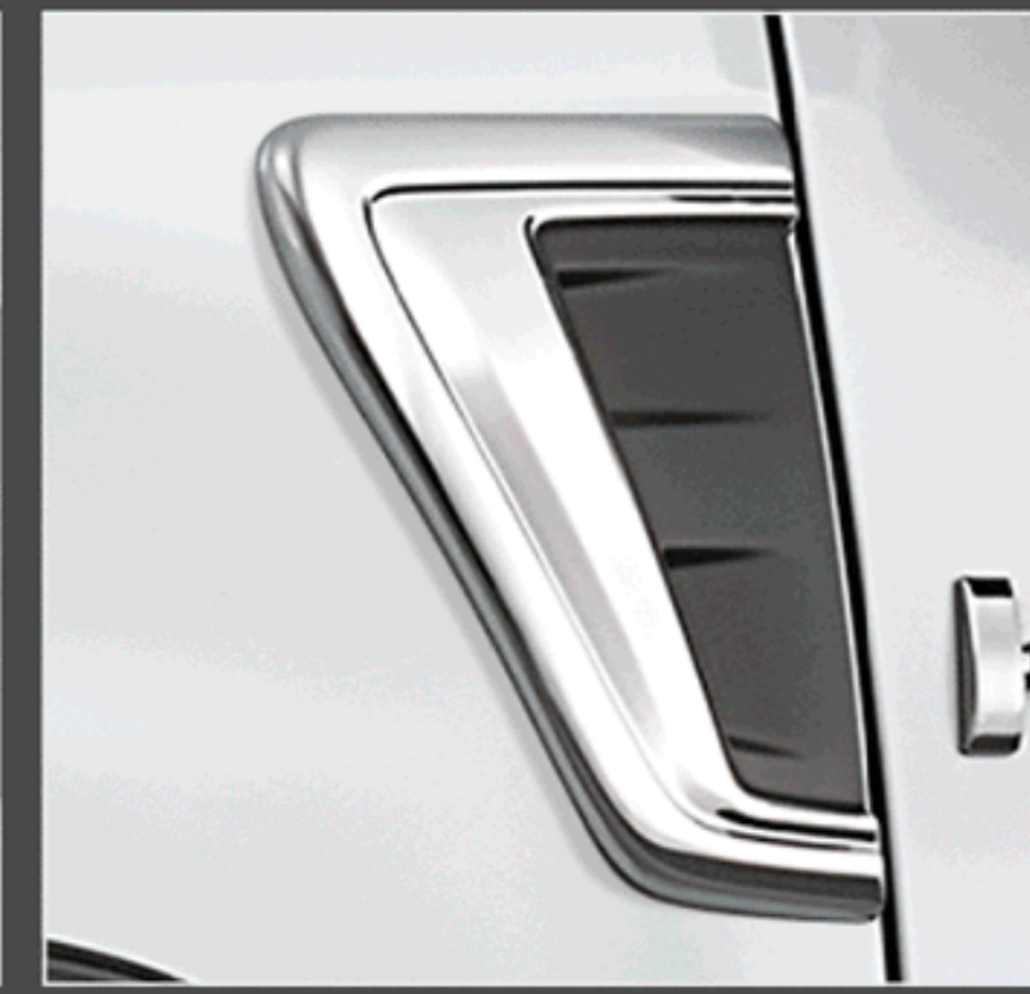
คิ้วตกแต่งซุ้มล้อโครเมียม