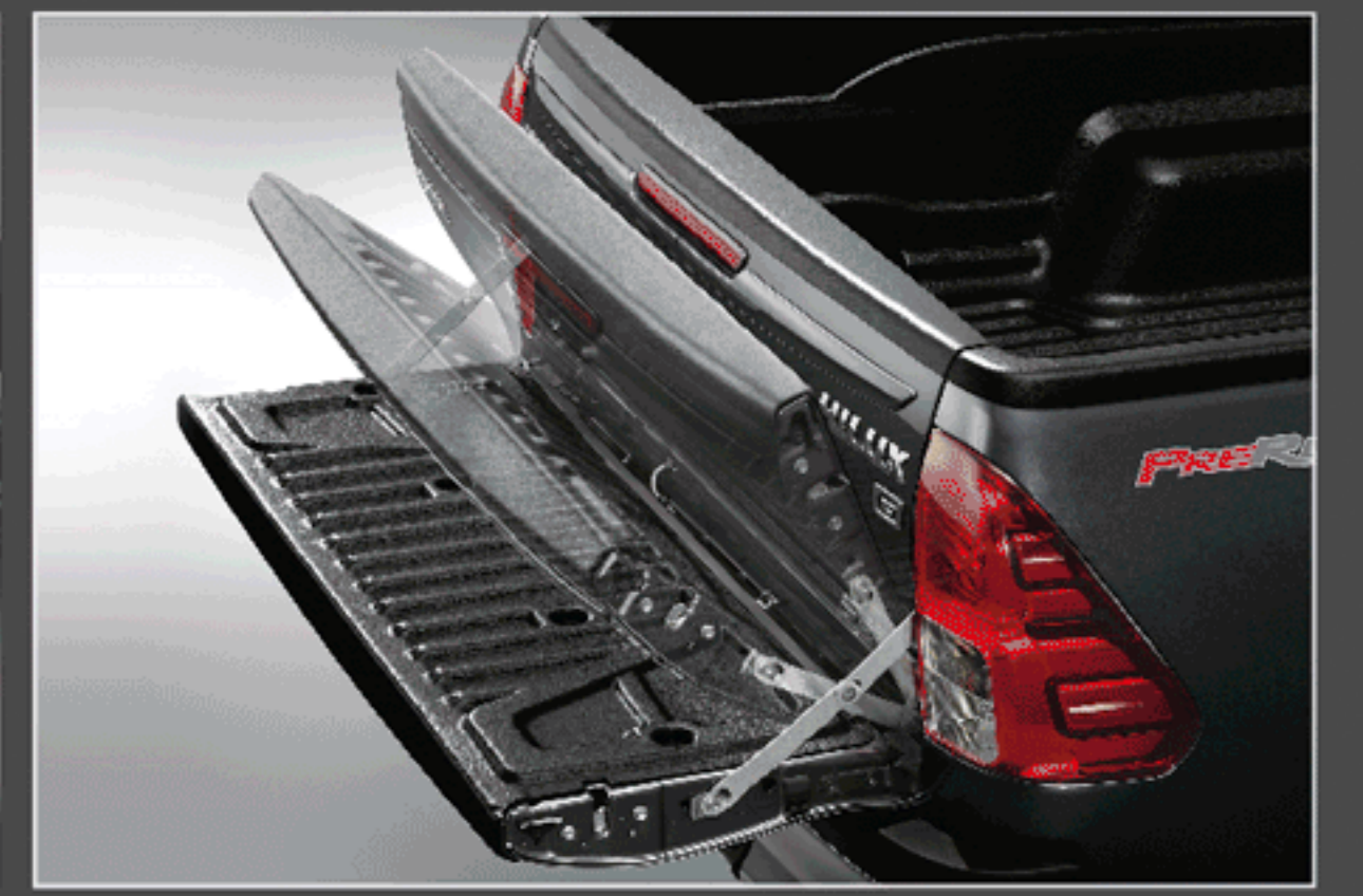
อุปกรณ์ช่วยผ่อนแรงเปิด-ปิดฝาท้ายกระบะ