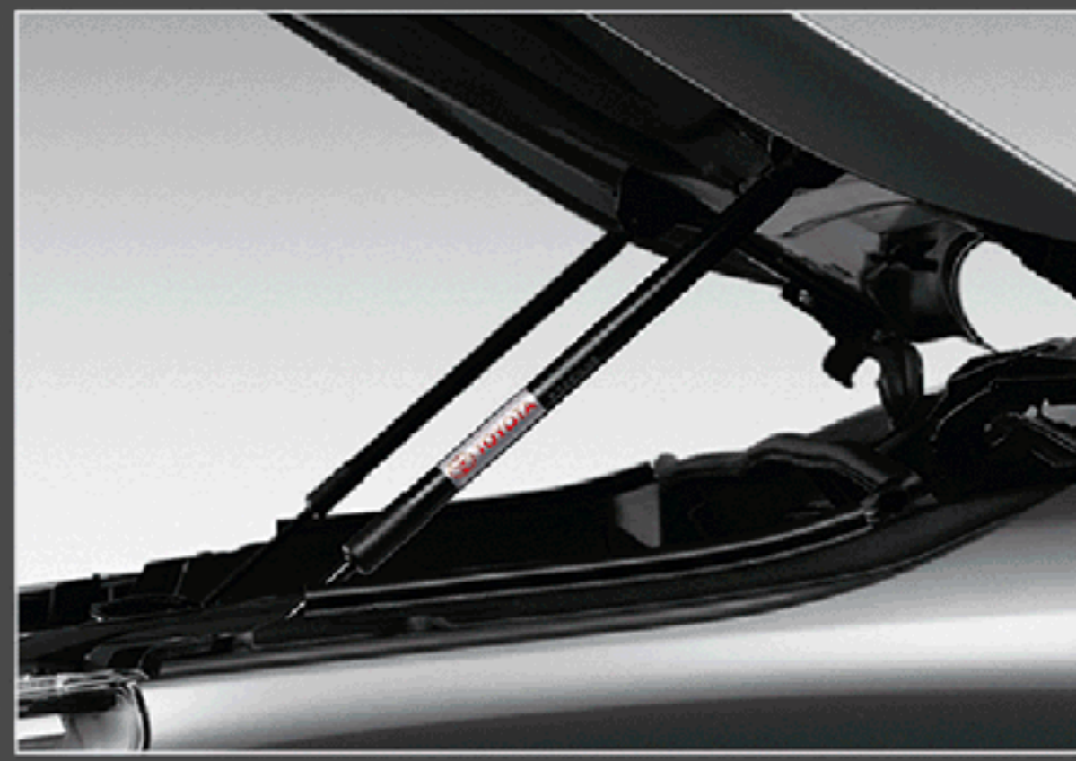
อุปกรณ์ช่วยผ่อนแรงเปิด-ปิดฝากระโปรงหน้า