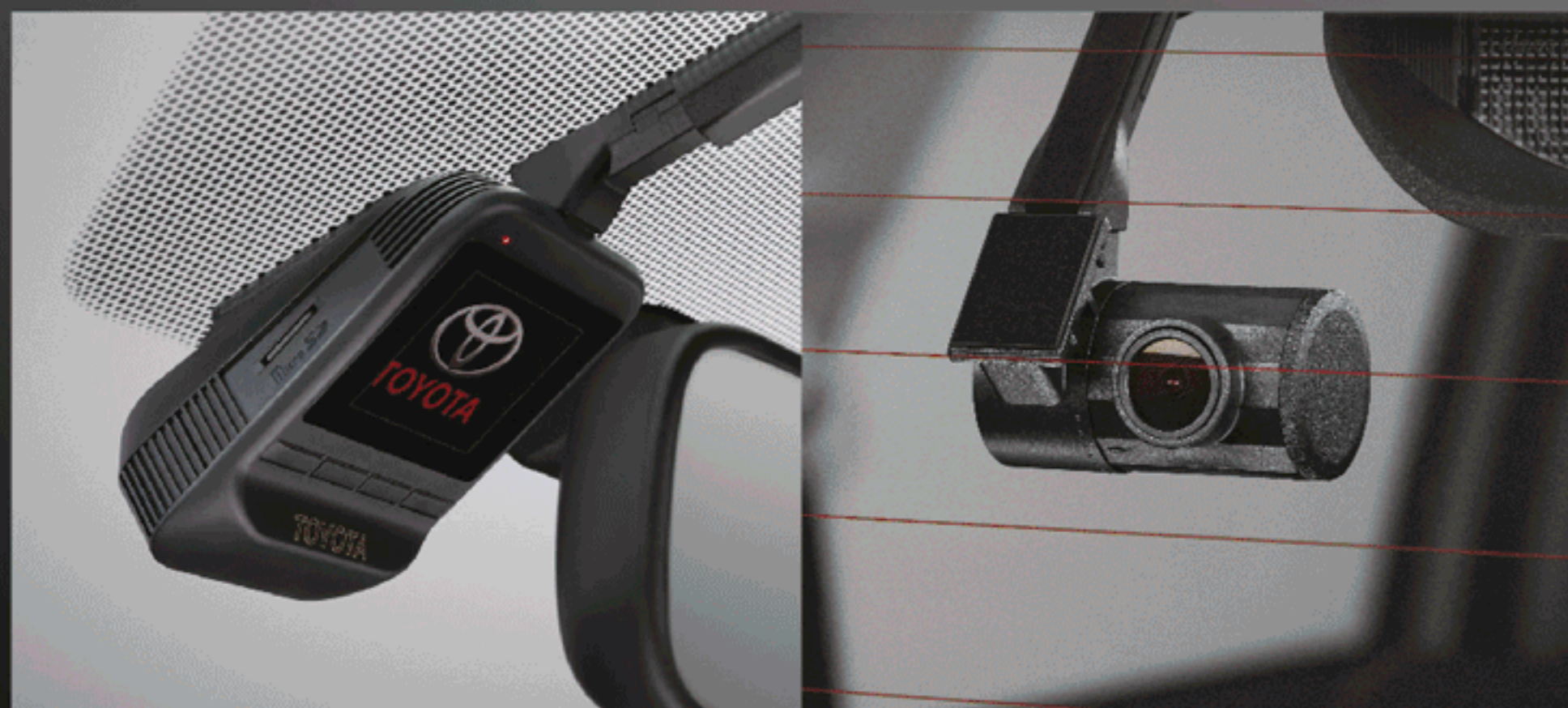
กล้องบันทึกภาพด้านหน้า รุ่นสมาร์ท แค็บ / รุ่นดับเบิล แค็บ กล้องบันทึกภาพด้านหน้า-หลัง รุ่นดับเบิล แค็บ