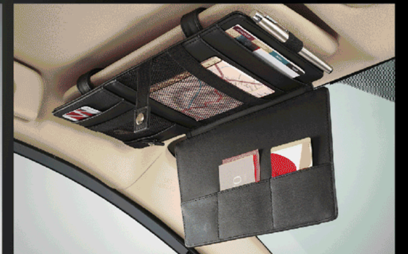
แผงบังแดดคอนทอปประสงค์