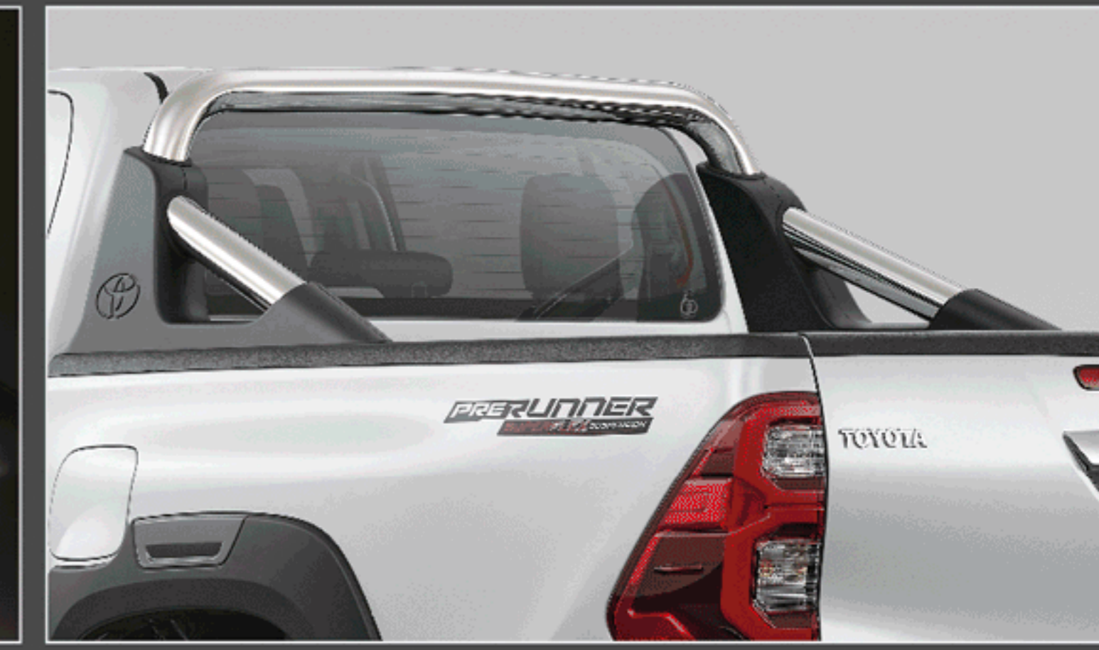
สไตลิสบาร์