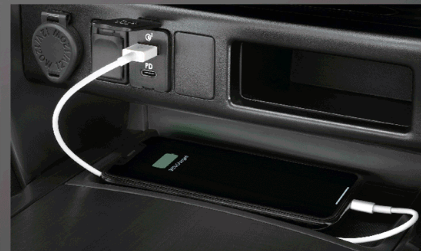
ที่ชาร์จภายในรถยนต์ (USB)