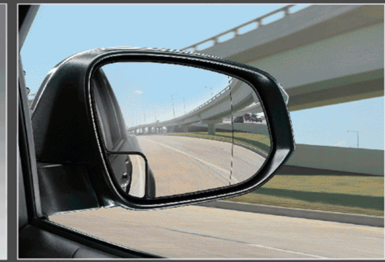
กระจกข้างช่วยมองมุมอับสายตา