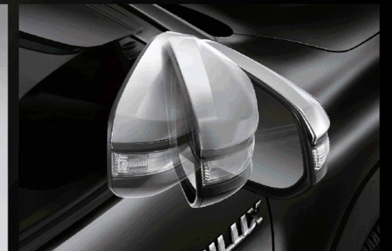
ชุดควบคุมระบบพับกระจกอัตโนมัติ

อุปกรณ์ตกแต่งแท้โตโยต้ารับประกันสูงสุด 3 ปี หรือ 100,000 กม. (ตามรุ่นรถยนต์ที่บริษัทฯ กำหนด โปรดศึกษารายละเอียดจากคู่มือรับประกันคุณภาพ และคู่มือการใช้งานรถยนต์)