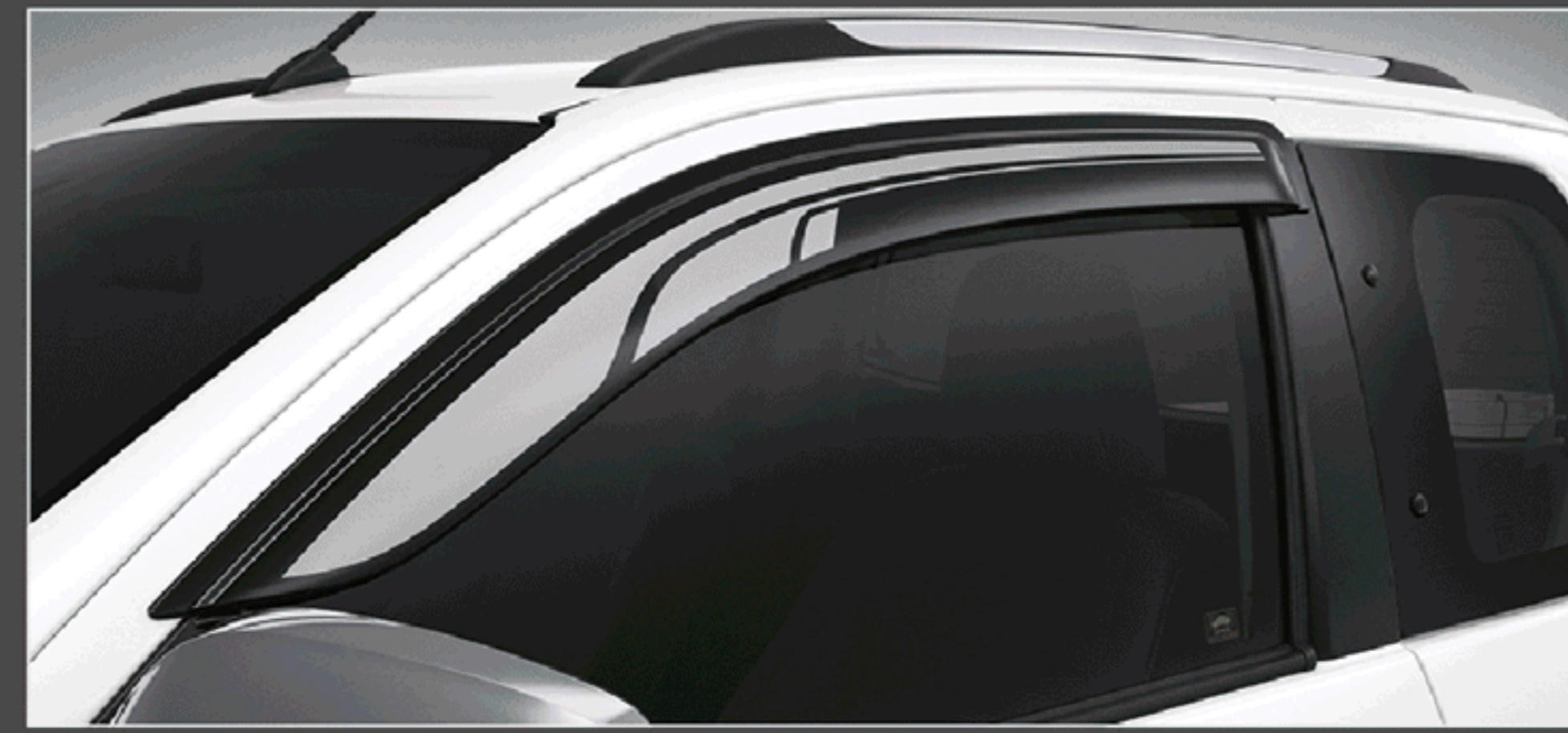
แผงบังแดดข้าง (แบบลายสกรีน) รุ่นสมาร์ท แค็บ