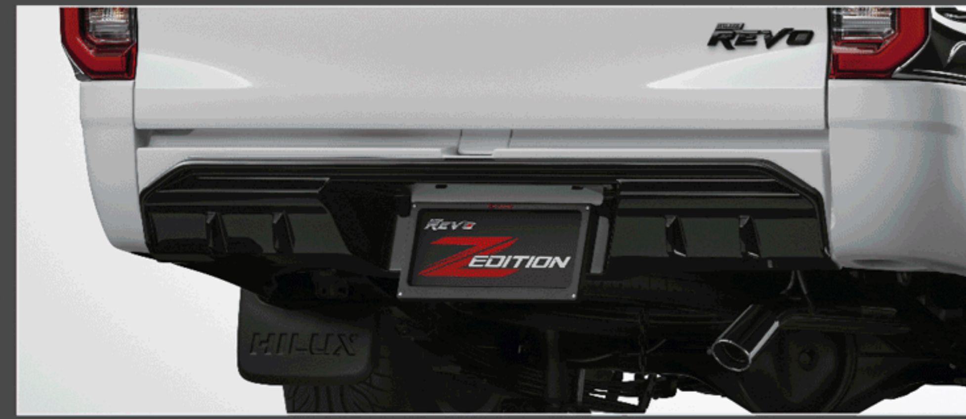
ชุดตกแต่งกันชนท้ายสีเงา