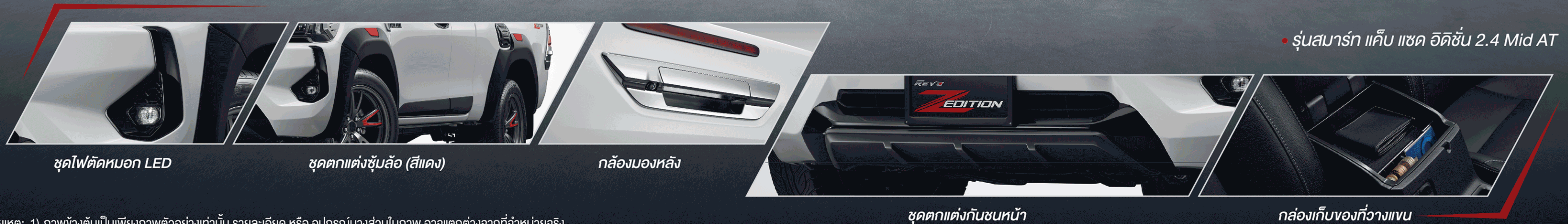
ชุดไฟตัดหมอก LED