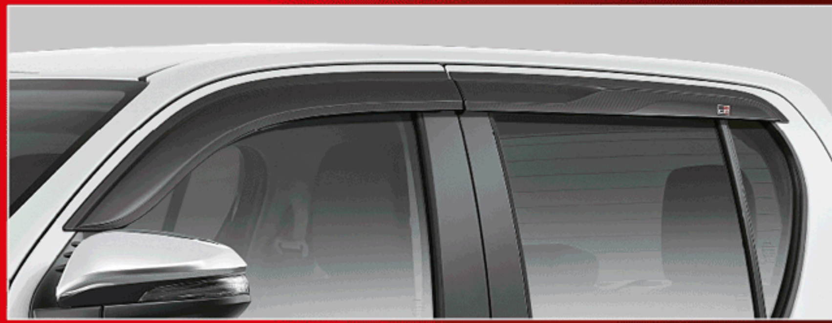
แผงบังแดดข้าง GR รุ่นดับเบิล แค็บ