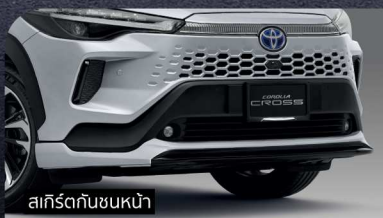
สเกิร์ตกันชนหน้า