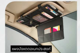
แผงบังแดดแบบประสมค์

อุปกรณ์ตกแต่งแท้โตโยต้ารับประกันสูงสุด 3 ปี หรือ 100,000 กม. (ตามรุ่นรถยนต์ที่บริษัทฯ กำหนด โปรดศึกษารายละเอียดจากคู่มือการรับประกันคุณภาพ และคู่มือการใช้งานรถยนต์)