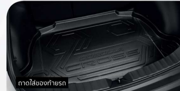
ถาดใส่ของท้ายรถ