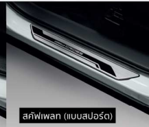
สลิฟวิวน (แบบสปอร์ต)