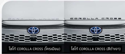
โลโก้ COROLLA CROSS (ครีมเมียม) โลโก้ COROLLA CROSS (สีด่างเงา)