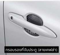
กรอบรองที่จับประตู (ลายเคลือบ)