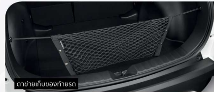
ตาข่ายเก็บของท้ายรถ