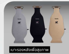
เบาะรองหลังเพื่อสุขภาพ