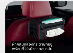
ผ้าคลุมรถจักรยานยนต์ พร้อมที่ใส่หมวกก่อนามิช