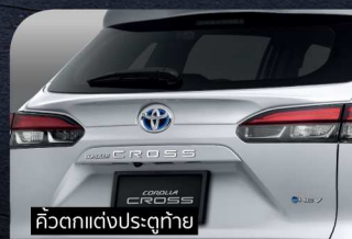
คิ้วตกแต่งประตูท้าย