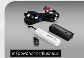
เครื่องพอกอากาศในรถยนต์