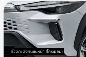
คิ้วตกแต่งกันชนหน้า (ครีมเมียม)