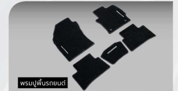
พรมปูพื้นรถยนต์