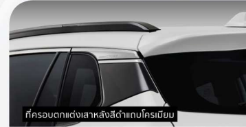
ที่ครอบตกแต่งเสาหลังสีด่างเงาครีมเมียม