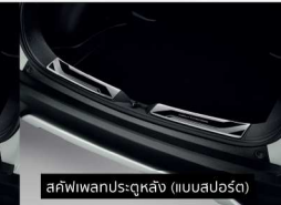
สลิฟวิวนประตูหลัง (แบบสปอร์ต)