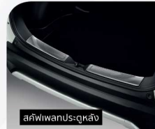
สลิฟวิวนประตูหลัง