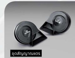
ชุดสัญญาณแตร