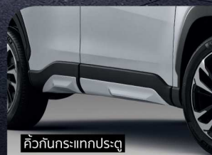
คิ้วกันกระแทกประตู