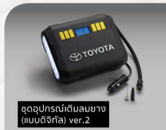
ชุดอุปกรณ์เติมน้ำมัน (แบบดิจิทัล) ver.2