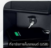
ที่ชาร์จภายในรถยนต์ (USB)