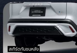
สเกิร์ตกันชนหลัง