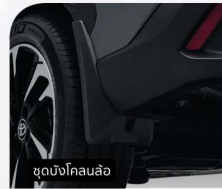
ชุดบังโคลนล้อ