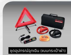
ชุดอุปกรณ์ฉุกเฉิน (แบบกระเป๋าน้ำ)