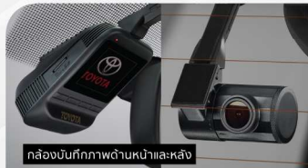
กล้องบันทึกภาพด้านหน้าและหลัง