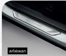
สลิฟวิวน