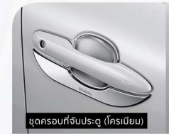
ชุดกรอบที่จับประตู (ครีมเมียม)