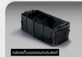
กล่องเก็บของแบบประสมค์