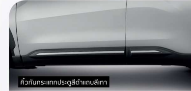
คิ้วกันกระแทกประตูสีด่างเงาสีเทา