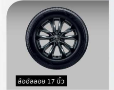
ล้ออัลลอย 17 นิ้ว