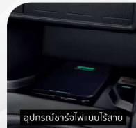
อุปกรณ์ชาร์จไฟแบบไร้สาย