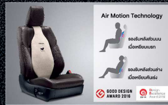
เบาะรองหลังเพื่อสุขภาพ คำ/ครีมี 3,990.-

TOYOTA ACCESSORIES อุปกรณ์ตกแต่งแท้โตโยต้ารับประกันสูงสุด 3 ปี หรือ 100,000 กม. (โปรดศึกษารายละเอียดจากคู่มือสินค้าและเว็บไซต์)