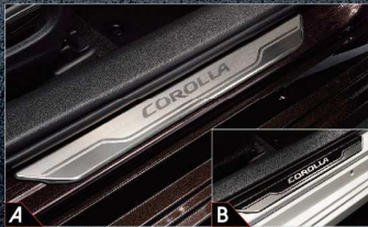
A. สติฟพลาสติกแบบมาตรฐาน 1,650.- B. สติฟพลาสติกแบบสปอร์ต 3,200.-