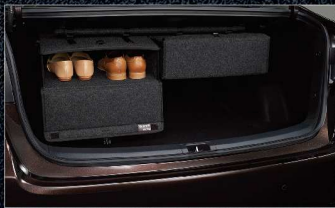
กล่องแขวนของประตูหลังท้ายรถ 1 กล่อง 1,600.- / 2 กล่อง 2,600.-