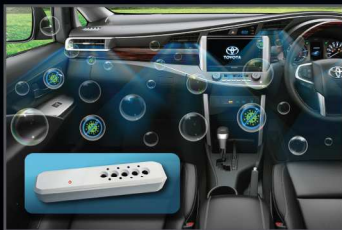
เครื่องฟอกอากาศในรถยนต์ (แบบปล่อยประจุ)