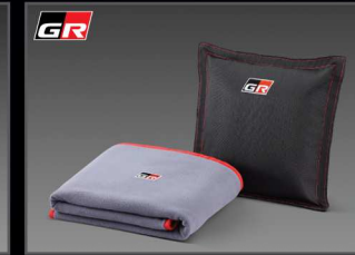
หมอนอนเบาะประสก GR แบบ 2in1