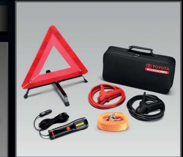
ชุดอุปกรณ์ฉุกเฉิน (แบบกระเป๋าผ้า)