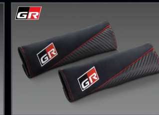
ปลอกหุ้มเข็มขัดนิรภัย GR