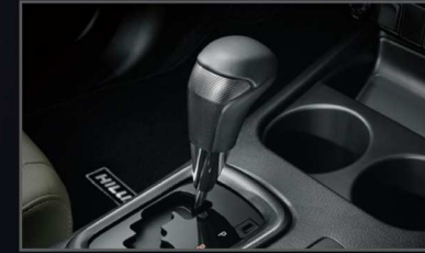
หัวเกียร์สายสปอร์ต (เกียร์อัตโนมัติ)