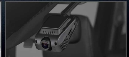
กล้องบันทึกภาพด้านหน้า