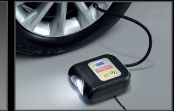
ชุดอุปกรณ์ติบลมยาง (แบบดิจิตอล)