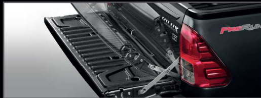
อุปกรณ์ช่วยผ่อนแรงเปิด-ปิดฝาท้ายกระบะ