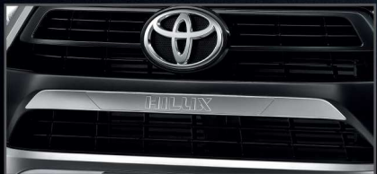
คิ้วกระจังหน้าโครเมียม

รุ่นมาตรฐาน ขับเคลื่อน 2 ล้อ 2.4 Entry MT