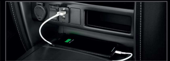
ที่ชาร์จภายในรถยนต์ (USB)

อุปกรณ์ตกแต่งแท้โตโยต้ารับประกันสูงสุด 3 ปี หรือ 100,000 กม.