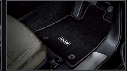
พรมปูพื้นรถยนต์ (เกียร์ธรรมดา)