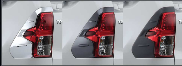
คิ้วไฟท้าย (โครเมียม/เทาดำเงา/ดำด้าน)