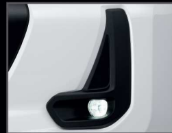
ชุดไฟตัดหมอก LED