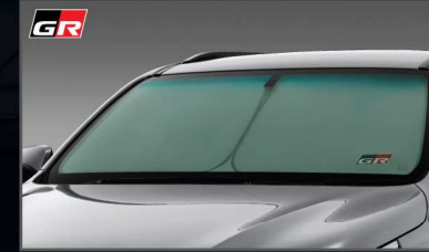
ที่บังแดดด้านหน้า GR