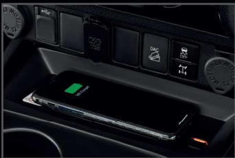
อุปกรณ์ชาร์จไฟแบบไร้สาย