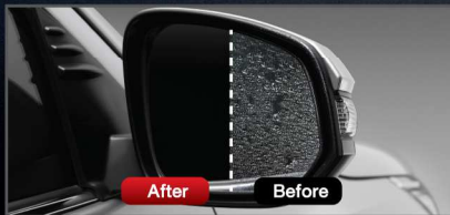
แผ่นฟิล์มกันน้ำเกาะกระจกมองข้าง