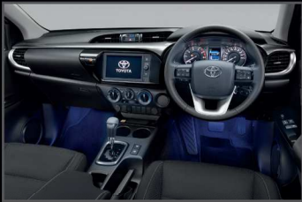
ชุดไฟส่องสว่างพื้นรถ (2 จุด)