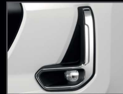
กรอบไฟตัดหมอกโครเมียม