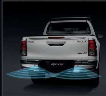
สัญญาณเตือนกระแทกท้ายรถ