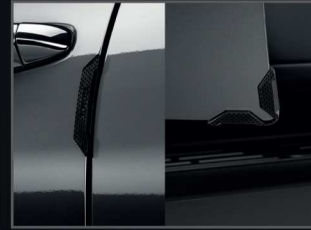
กันกระแทกขอบประตูและมุมประตู