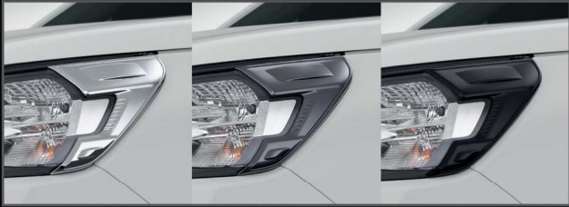
คิ้วไฟหน้าฮาโลเจน (โครเมียม/เทาดำเงา/ดำด้าน)