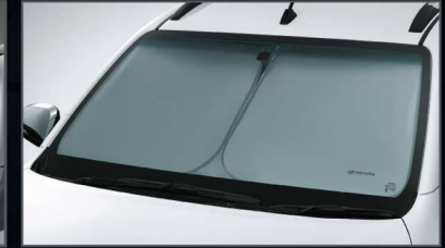
ที่บังแดดด้านหน้า