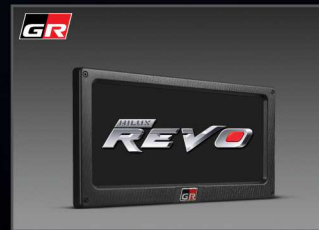
กรอบป้ายทะเบียน GR