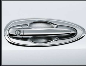
ชุดครอบที่จับประตู (โครเมียม)