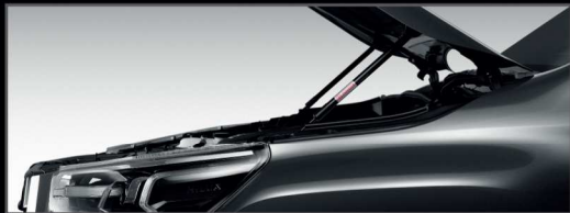
อุปกรณ์ช่วยผ่อนแรงเปิด-ปิดฝากระโปรงหน้า