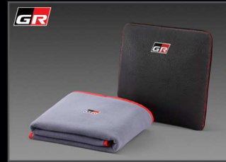
หมอนอนเบาะประสก GR แบบ 3in1