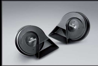
ชุดสัญญาณแตร