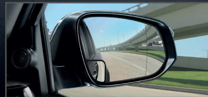
กระจกข้างช่วยมองมุมอับสายตา