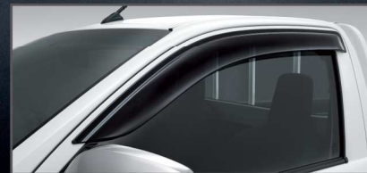
แผงบังแดดข้าง