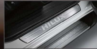
สตัฟฟ์พวง รุ่นดับเบิล แค็บ