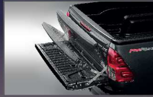
อุปกรณ์ช่วยผ่อนแรงเปิด-ปิด ฝาท้ายกระบะ