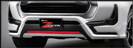
สเกิร์ตกันชนหน้า