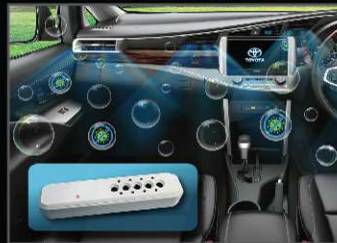
เครื่องฟอกอากาศในรถยนต์ (แบบปล่อยประจุ)