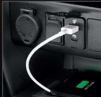
ที่ชาร์จภายในรถยนต์ (USB)