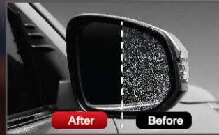
แผ่นฟิล์มกันน้ำเกาะกระจกรมองข้าง