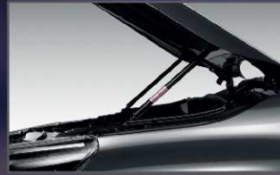
อุปกรณ์ช่วยผ่อนแรงเปิด-ปิด ฝากระโปรงหน้า