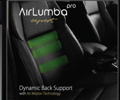
ระบบบริหารหลังไฟฟ้า (บริเวณหลังส่วนล่าง)