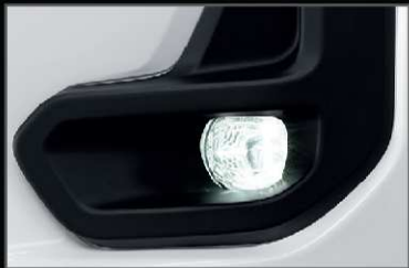
ชุดไฟตัดหมอก LED