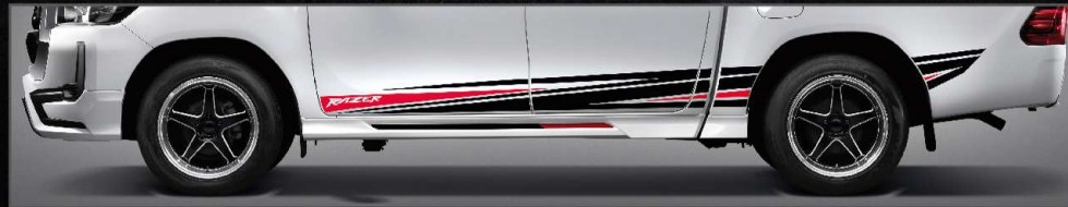
สติ๊กเกอร์ตกแต่งด้านข้าง รุ่นดับเบิล แเค็บ และ รุ่นสมาร์ต แเค็บ