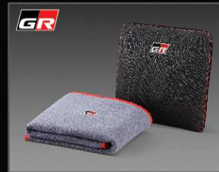
หมอนอนกประสงค์ GR แบบ 3in1