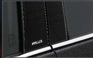
สติ๊กเกอร์ตกแต่งเสาประตู