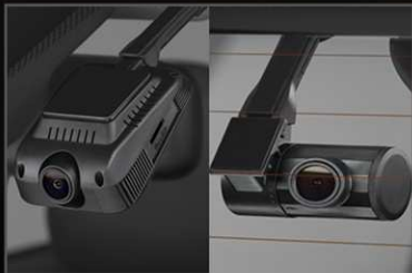
กล้องบันทึกภาพด้านหน้าและหลัง