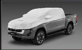
ผ้าคลุมรถแบบครึ่งคัน