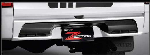
สเกิร์ตกันชนหลัง