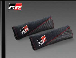
ปลอกหุ้มเบาะชนิดนิรภัย GR