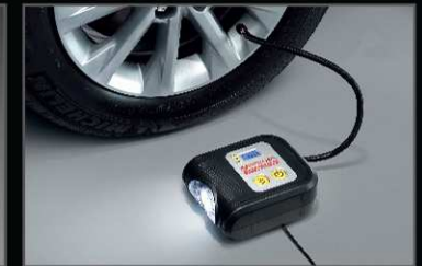
ชุดอุปกรณ์เติมลมยาง (แบบดิจิทัล)