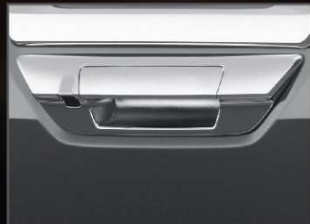
กล้องมองหลัง