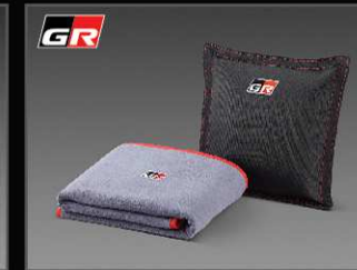
หมอนอนกประสงค์ GR แบบ 2in1