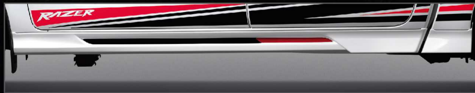
ชุดสเกิร์ตด้านข้าง รุ่นดับเบิล แเค็บ และ รุ่นสมาร์ต แเค็บ