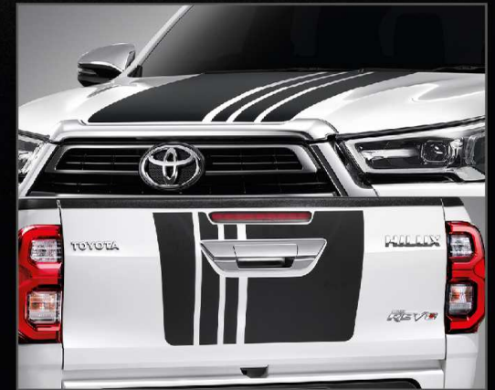
สติ๊กเกอร์ตกแต่งฝากระโปรงหน้าและฝาท้ายกระบะ

อุปกรณ์ตกแต่งแท้โตโยต้ารับประกันสูงสุด 3 ปี หรือ 100,000 กม.