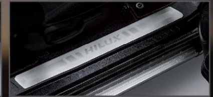
สตัฟฟ์พวง รุ่นสมาร์ท แค็บ