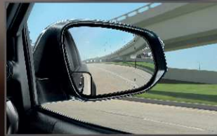
กระจกข้างช่วยมองมุมอับสายตา