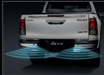
สัญญาณเตือนกะระยะท้ายรถ