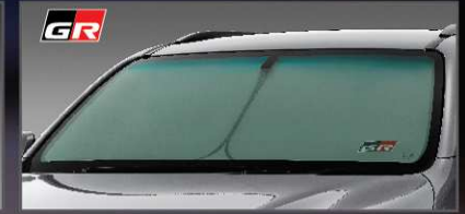
ที่บังแดดด้านหน้า GR