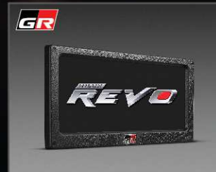
กรอบป้ายทะเบียน GR