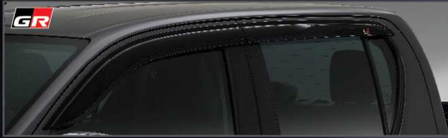
แผงบังแดดข้าง GR